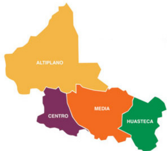
Imagen 2. Localización de las 4 regiones que conforman el territorio potosino.

al desarrollo de oportunidades para poder impulsar el desarrollo humano a nivel individual y a nivel de las comunidades. Sin embargo, los recursos y el potencial que puedan tener las regiones y algunas de sus localidades requieren desarrollar un intenso proceso de seguimiento y monitoreo de todos los aspectos que se encuentran involucrados en la puesta en marcha de estos proyectos. Es decir, se hace necesario relacionar los recursos naturales-ambientales con los intereses económicos, los intereses políticos de los agentes locales y de los agentes extralocales (Rangel Valadés, Norma Lucero 2011; Pineda Manzano, Ulises 2010).