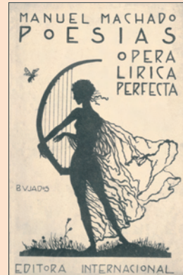
Cubierta de Bujados para Poesías: (opera omnia lírica) de Manuel Machado (1924).