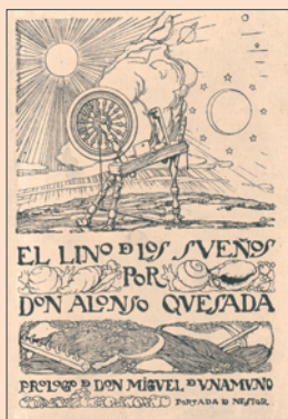
Cubierta de Néstor para El lino de los sueños de Alonso Quesada (1915).