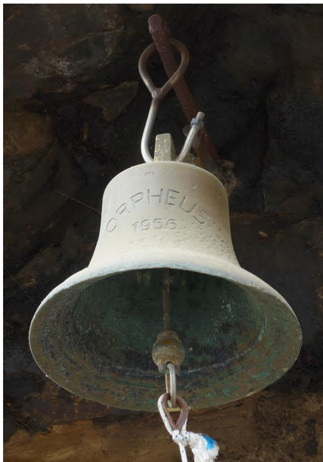
Fig. 9. Campana Orpheus . 1956. Santuario de la Virgen de Fátima. Barranco Hondo de Abajo. Municipio: Gáldar.

Comentario: Bronce perteneciente al buque griego Orpheus , construido en 1956 25 . Destinado para el transporte de cemento, en 1977 fue rebautizado con el nombre de Katerina A. , razón por la cual suponemos que la campana con la denominación original fue desmontada del mentado buque. Posteriormente, dicha pieza fue empleada para el servicio de la cueva-ermita de la Virgen de Fátima, bendecida el 16 de mayo de 1971 (Fig. 9) 26 .