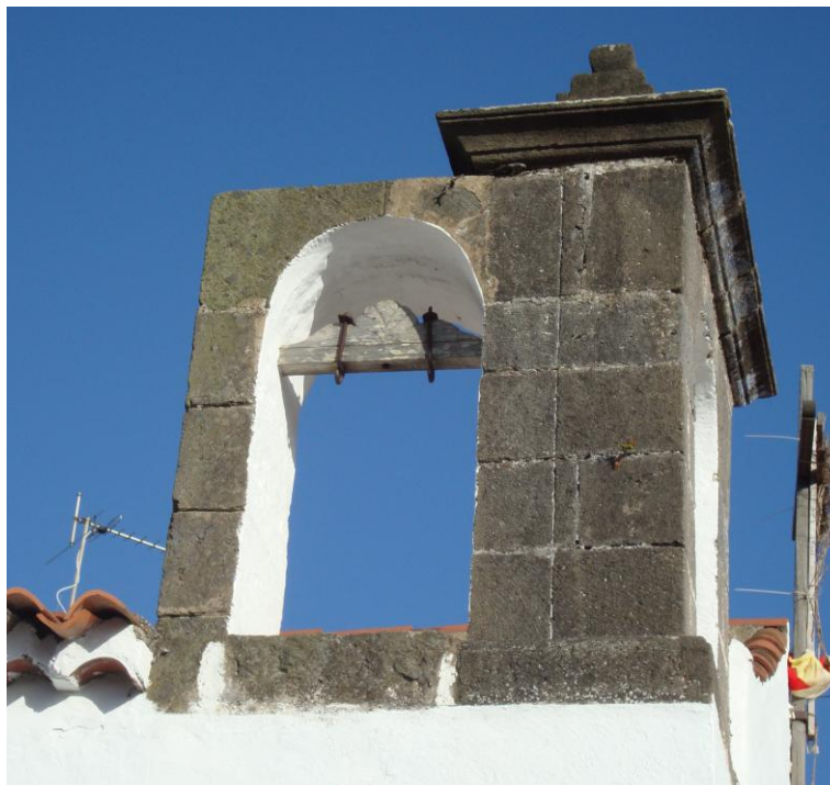
Fig. 7. Espadaña y tronera donde estuvo ubicada la desaparecida campana procedente del vapor Zuleika . Ermita de Ntra. Sra. de las Nieves. El Palmar. Municipio: Teror.

Canaria en octubre de 1920 (Fig. 7) 21 . Se trataba de la campana del puente de mando, donada tras del desguace del barco por un devoto de la imagen a la predicha ermita —y desaparecida tras ser bajada para ser sometida a reparación— pues al parecer presentaba una grieta 22 . Sobre el aspecto de la campana en cuestión nos podemos hacer una idea bastante aproximada, puesto que aún se conserva una segunda pieza más pequeña —campana de proa— en la que figura el nombre del buque —ZULEIKA— seguido del año de fabricación del barco, 1899 23 .