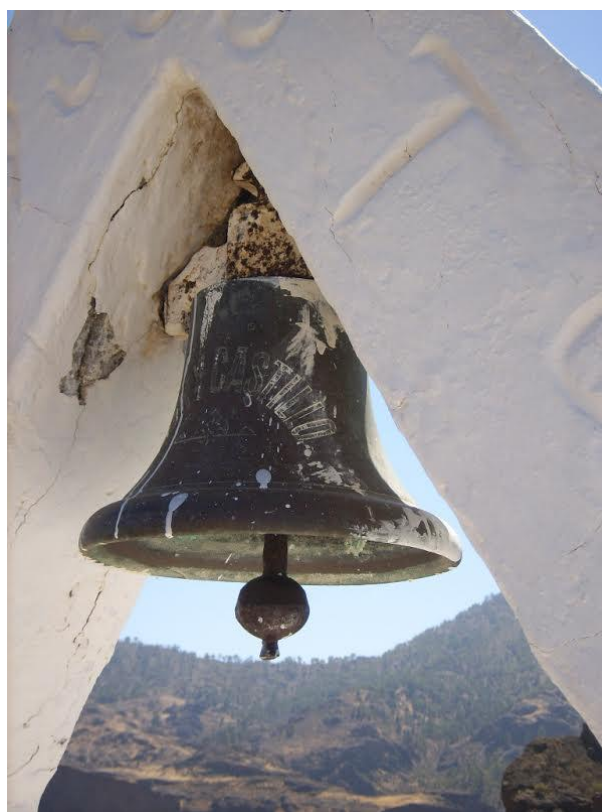
Fig. 4. Campana León y Castillo . 1888. Cruz del Toscón. El Toscón. Municipio: Tejeda.

Comentario: La pieza que nos ocupa (Fig. 4) perteneció al vapor denominado León y Castillo (Fig. 5), construido en Inglaterra en 1888 y cuyo nombre hace mención al abogado, político y diplomático español natural de la localidad de Telde, don Fernando León y Castillo (1842-1918) 16 . Incorporado al servicio de correo marítimo su pérdida se produjo el 17 de octubre de 1910, en el sitio conocido como Montaña Decepción, a 22 millas al norte del Río de Oro, cuando transportaba agua y víveres para la guarnición española establecida allí 17 . Entre los objetos recuperados del naufragio se cuenta esta campana en cuyo tercio se reproduce el nombre del mentado buque. Desde el año 1968 cuelga de un campanil localizado en el barrio de El Toscón (Tejeda) construido por un vecino de aquel lugar, sin que sepamos exactamente por quién y cómo fue adquirida tras la desaparición del barco 18 .