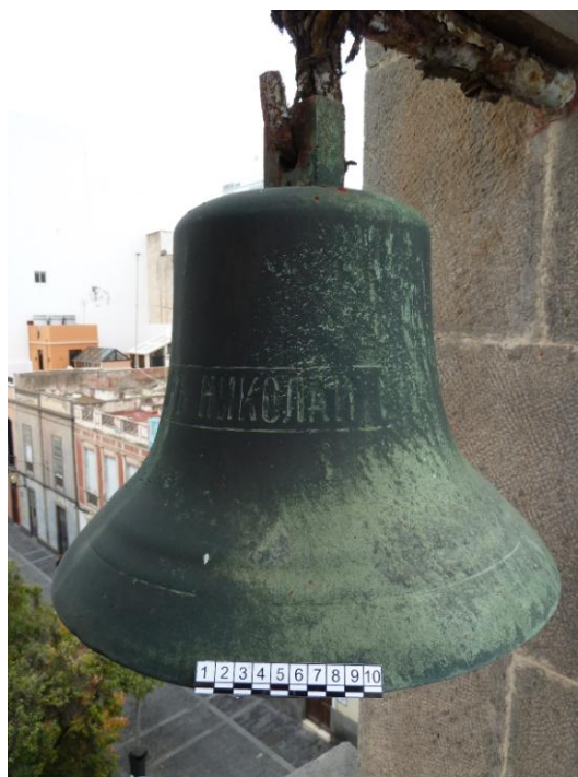
Fig. 2. Campana Imperator Nikolas. ca. 1825-1855. Iglesia de San Antonio de Padua de los Padres Franciscanos. Triana. Las Palmas de Gran Canaria.