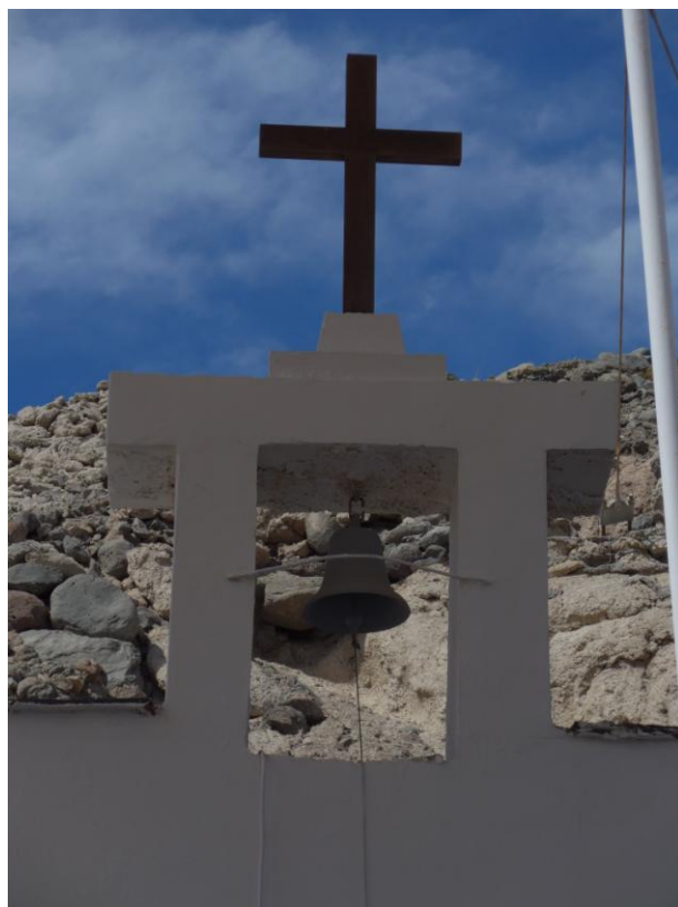
Fig. 6. Campana Emma . 1898. Ermita de Santa Águeda. Arguineguín, El Pajar. Municipio: Mogán.

tipo de motivo ornamental o iconográfico en cuya parte central figura el nombre del buque al que perteneció, así como su fecha de fundición o fabricación 20 .