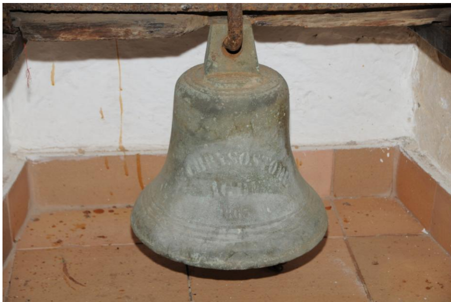
Fig. 3. Campana Chrysostome . 1863. Ermita de San José. San José de las Longueras. Municipio: Telde.

Comentario: Son muy pocos los datos que poseemos sobre esta campana (Fig. 3). Probablemente sustituyó al bronce original que debió de haber tenido la ermita, fundada en el siglo XVI. De momento no nos consta a qué embarcación pudo haber pertenecido, si bien sus reducidas dimensiones, así como la morfología de sus asas nos hacen pensar que pudo haber prestado servicio en algún barco. Sus únicos motivos ornamentales son los cordones situados en su hombro y medio-pie, a los que acompaña la inscripción que reproducimos en la ficha de arriba 15 .