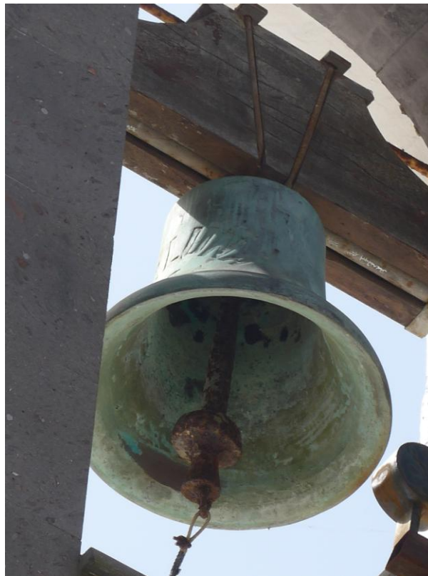
Fig. 8. Campana Catalina. ca. 1850-1890. Parroquia de San Luis Gonzaga. Valsendero Municipio: Valleseco.

Comentario: No disponemos de datos sobre la adquisición de esta campana, que según parece debe estar fechada en el siglo XIX (Fig. 8). Se trata de un dato que sólo podremos contrastar cuando nos sea posible leer la fecha que luce en su zona media, de la que sólo hemos podido registrar la cifra de «18». En cambio, a pesar de lo inaccesible de la pieza, hemos podido leer el nombre de «CATALINA», sin que tampoco podamos precisar a qué buque se hace mención 24 .