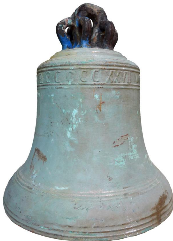
Fig. 1. Campana Heyrincvs . 1527. Parroquia de San Pedro de Bañaderos. Municipio. Arucas. Fotografía de los autores.

En la playa próxima a la ciudad de Gáldar, conocida con el nombre de El Agujero , se ha extraído, hace pocos días, por el vapor Mariposa dos cañones, que se hallaban allí ocultos desde remota época. Las exploraciones de estos restos, como de una campana que se creía en la misma rada sumergida , se deben a la iniciativa del Reverendo Arcipreste del pueblo, y el descubrimiento de dichas dos piezas a uno de los buzos que trabajaba en el puerto de Sardiña. Otro cañón y una rueda cureña fueron igualmente descubiertos, pero la extracción se hizo imposible por tener grandes adherencias políperas que lo impedían.