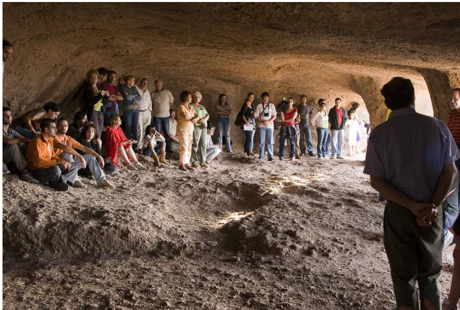
Foto 3. Destrucción institucional del patrimonio arqueoastronómico. Cueva de las Cuatro Puertas (25 de junio 2009).