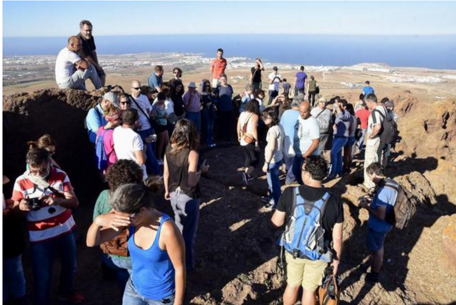
Foto 4. Destrucción institucional del patrimonio arqueoastronómico. Almogarén de Cuatro Puertas (22 de junio 2016).