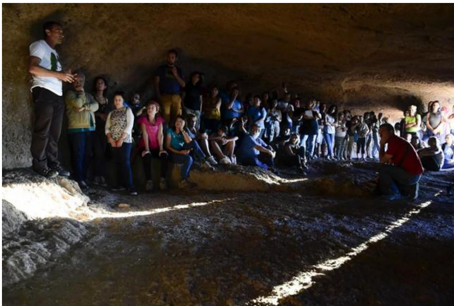
Foto 5. Destrucción institucional del patrimonio arqueoastronómico. Cueva de las Cuatro Puertas (22 de junio 2016).