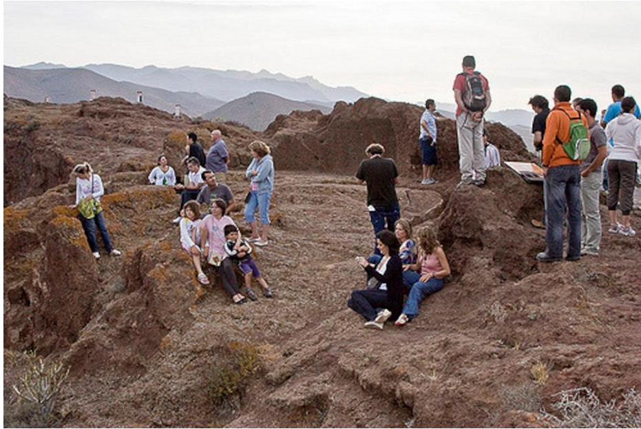
Foto 2. Destrucción institucional del patrimonio arqueoastronómico. Almogarán de Cuatro Puertas (25 de junio 2009).