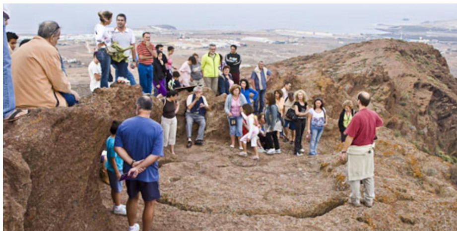
Foto 1. Destrucción institucional del patrimonio arqueoastronómico. Almogarén de Cuatro Puertas (25 de junio 2009).