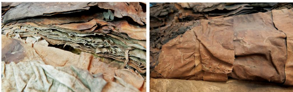
Figura 8: Detalle de los pliegues de los lienzos que integran el fardo y cintas de cuero que los sujetan.