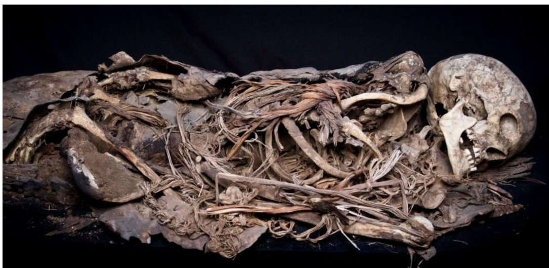
Figura 2: Detalle de fardo funerario mixto realizado con piel animal y tejido vegetal. El Museo Canario.

En cuanto a la aplicación corporal de sustancias naturales que pudieran favorecer el proceso de momificación, como se describe en las crónicas y primeras historias desde la conquista, en el caso de Gran Canaria de momento no está documentada. Ello no es óbice para considerar que los muertos pudieran haber sido procesados mediante alguna fórmula de desecación y aplicación de productos de origen vegetal/animal, en un sentido ritual de preparación al tránsito que impone la muerte como así es habitual en las culturas tradicionales. Más allá, es difícil asumir que se trataba de un mecanismo encaminado a la preservación eterna del cuerpo, pues los propios aborígenes fueron testigos de la ineficacia de tales tratamientos en el sentido propuesto, constatando la putrefacción y esqueletización de sus muertos, tal y como nosotros lo hacemos hoy. En la misma línea, la presencia de fauna cadavérica en el interior de los fardos indica que el proceso de putrefacción se dio en todas sus fases desde el mismo instante de la muerte 6 , con lo que la efectividad de dichos tratamientos quedaba abiertamente limitada y patente a los ojos de los antiguos canarios.