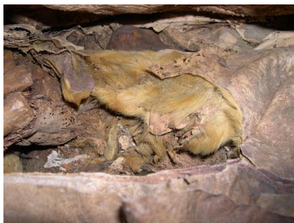
Figura 7: Detalle piel de oveja con el pelo hacia el cuerpo del Individuo.