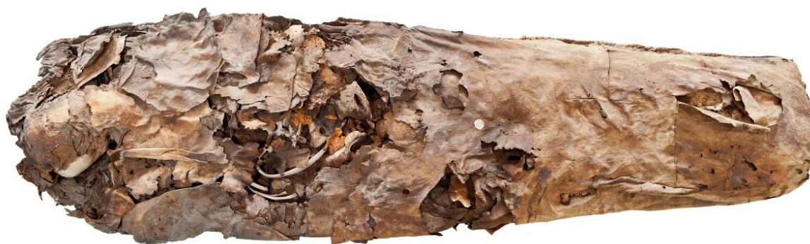
Figura 1: Ejemplo de fardo mortuorio en piel, realizado mediante la unión de diversos fragmentos de cuero. El Museo Canario.

Cuando se usa la piel (fig. 1), estos lienzos se confeccionan a partir de la unión de múltiples trozos de diversas procedencias, formas y dimensiones, componiendo una suerte de sabaña de mayor o menor tamaño según los casos, pero no obligatoriamente condicionada por las dimensiones que son requeridas y que casi siempre se superan. Cada lienzo puede enrollarse alrededor del cuerpo varias veces, creando sucesivas capas dentro del mismo envoltorio. Concluido este proceso, el saco creado se sujeta con correas transversales y así, una y otra vez, por cada lienzo que se emplee.