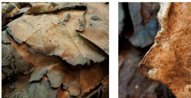
Figura 6: Detalle de parche y un ojal respectivamente.

A continuación, el cuerpo constreñido pasó a envolverse, empleado para ello largos lienzos de cuero. Para la Momia 8 se han registrado 4 de estos lienzos. Cada pieza se confecciona uniendo numerosos pedazos de piel hasta constituir una especie de sábana de grandes dimensiones 15 . Estos pedazos, al menos en los lienzos mayores, proceden de efectos domésticos o personales reciclados para la función funeraria, como se demuestra a partir de la presencia de parches, ojales con huellas de uso, restos de apéndices inútiles para la nueva función, etc., (fig. 6). Con todo, el acopio de retales necesarios para la elaboración de estos lienzos es muy alto, sobrepasando con creces las dimensiones requeridas en la envoltura. Para esta parte del proceso hay que destacar la excelente calidad de la costura, propia de un trabajo especializado, realizada a partir de diminutas puntadas regulares unidas con tendones animales (fig. 9). Debido a la irregularidad de las piezas utilizadas se deben implementar fragmentos de morfología triangular adicionales que ayudan a armonizar las formas para conseguir una hechura de tendencia cuadrangular. El lienzo interno es una zalea de oveja finamente adobada realizada con animales de corta edad, con el vellón dirigido hacia adentro en contacto con el cuerpo. Los lienzos restantes se realizan con cueros curtidos que en los casos analizados resultan de cerdo 16 (fig. 7).