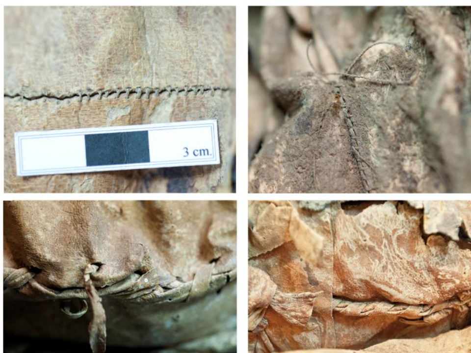
Figura 9: Superior: Detalle de las costuras que se practican para unir los trozos de cuero, realizadas con tendones animales y agujas de hueso. Inferior: Detalle de las costuras de unión de los lienzos realizadas mediante perforación de la piel ligadas por tiras extraídas del mismo lienzo.