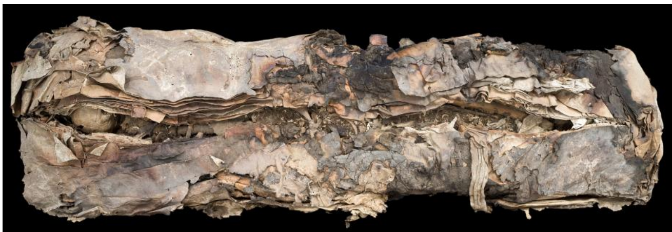
Figura 4: Fardo Momia 8. El Museo Canario.

La Momia 8 forma parte de la Colección de El Museo Canario (fig. 4) donde se encuentra desde 1901. Donada por el conde de la Vega Grande, no se sabe con seguridad su origen, aunque se apunta como más probable la localidad de Arguineguín. Corresponde a un varón de entre 20-25 años que no muestra signos de enfermedad importantes, a excepción de una fractura de rótula y tibia izquierda con recuperación total. Es la más célebre de todas las momias del museo no solo por las cualidades de su fardo, sino por la biografía que se le atribuyó. Con respecto al envoltorio, el elevado volumen de pieles que integra el paquete, único entre los ejemplares que se conservan en Gran Canaria, se ha considerado una señal inequívoca de la preeminencia social de la persona que las luce. Además, como rasgo individualizador, los restos óseos presentan una serie de evidencias de origen traumático relacionadas con su muerte.