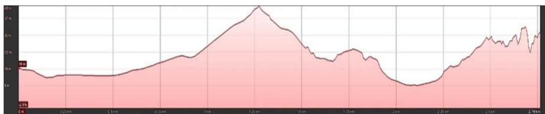
Mapa de la ruta y perfil topográfico [Imagen n.º 3].