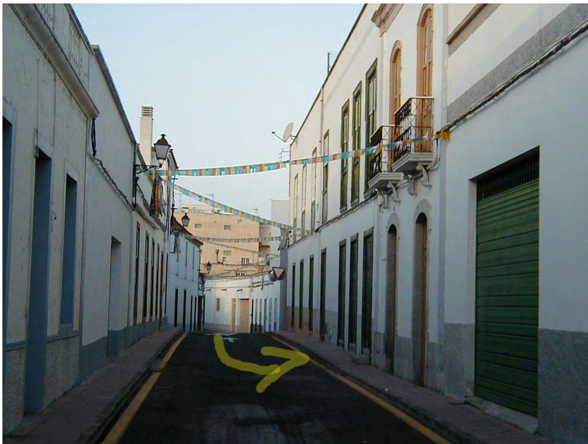
Lugar del atentado.