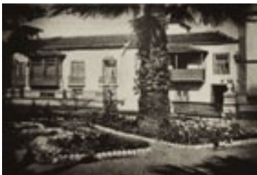
Casa de la familia Cólogan donde durmieron Humboldt y Bonpland (hotel Marquesa desde 1884).