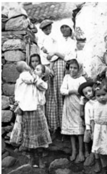
El atraso y el nivel de vida de Tenerife fue denunciado por Humboldt