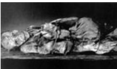
Los naturales destruían las momias guanches por superstición religiosa

Una práctica ancestral, incluso que se dio entre las clases altas. Las familias ricas de la isla presumía mucho de su linaje y se sentían altamente ofendidas si se les decía que eran descendientes de los moros o de los nativos de las islas, los guanches, afirma George Glas en 1764 (Glas, G. 1764, 287-88)