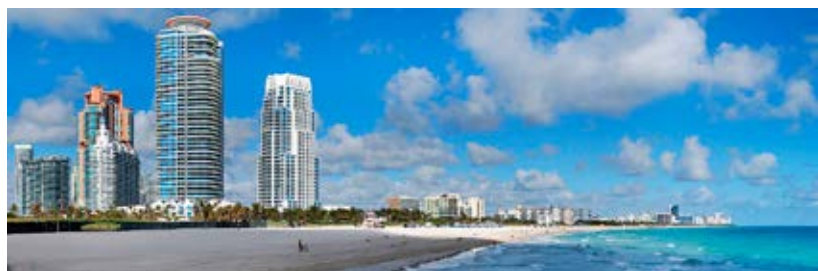
Fotografía 1. Panorama de Miami South Beach

Estas políticas de reposicionamiento de la ciudad han permitido que, hoy por hoy, Miami Beach siga desarrollando su estrategia turística guiada por el plan (1980-2020), y que sea considerado en la actualidad como un destino referente a escala mundial y nacional. Un destino totalmente rejuvenecido con una marca renovada y un portafolio turístico bien definido en torno a dos estrategias coordinadas que definen la ciudad turística: el ocio (asociado al modelo sun and beach ) (fotografía 1) y la cultura 14 (con importantes mejoras de las instalaciones culturales y artísticas en toda la ciudad).