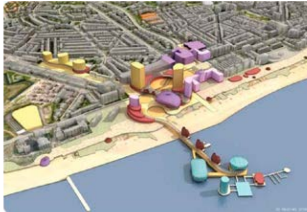
Figura 1. Actuaciones previstas del Proyecto de futuro 2020 de Scheveningen.