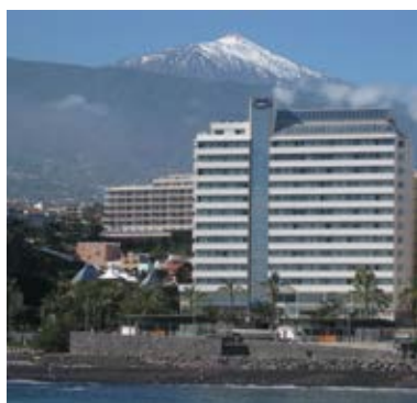
Fotografía 3. Cambios en la fachada en la renovación del Hotel Beatriz (2007-2011).