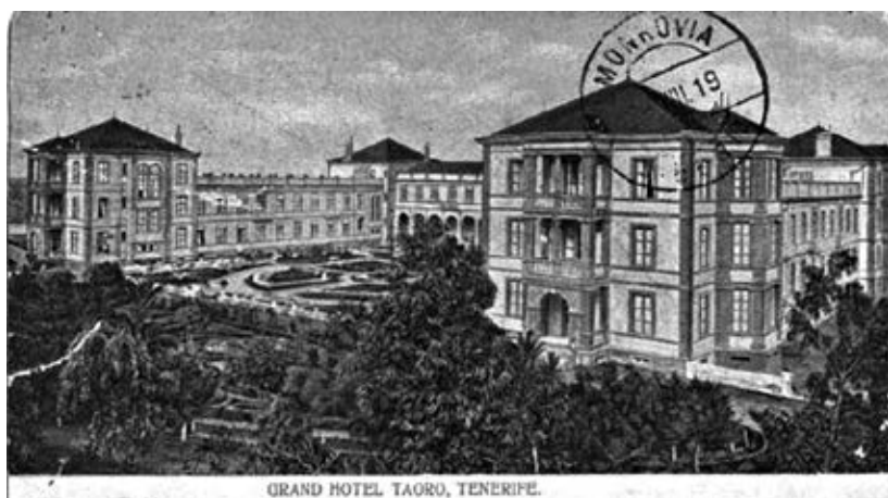
GRAND HOTEL TAORO, TENERIFE.

(1) Este trabajo se enmarca en el proyecto de I+D+i denominado "ReinventUR: Evaluación del impacto de las políticas públicas de renovación de destinos turísticos maduros. El caso de las Directrices de Ordenación del Turismo de Canarias" (SolSubC200801000279) financiado por la Agencia Canaria de Investigación, Innovación y Sociedad de la Información del Gobierno de Canarias y el Fondo Europeo de Desarrollo Regional (FEDER). [ http://sites.google.com/site/reinventur ]