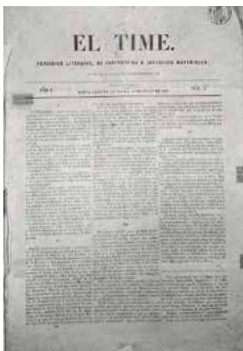
Número 1 del semanario El Time (Santa Cruz de La Palma, 12 de julio de 1863)

Sin embargo, la pequeña burguesía local demandaba una prensa capaz de editar un periódico en condiciones. Faustino Méndez Cabezola logró conformar una junta ciudadana y recaudó fondos para un taller tipográfico. Los palmeros emigrados a Cuba aportaron la suma necesaria, y en 1863 se compró en Londres la ansiada imprenta. El 12 de junio salió el primer periódico, El Time , que dio también su nombre a la propia imprenta. Hay que aclarar que la palabra «time» es una voz prehispánica que significa 'cima o borde de un precipicio'. Se utiliza como topónimo de varios lugares de La Palma, y es posible que los editores se permitieran bromear con el paralelismo con la voz inglesa time , tan periodística.