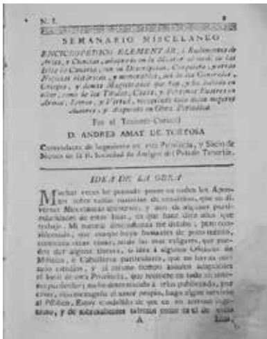
Primer número del Semanario misceláneo enciclopédico elemental (La Laguna, 1785).

(12) BONNET Y REVERÓN, Buenaventura: «La imprenta en Tenerife», El día (Santa Cruz de Tenerife, 25 de mayo de 1947), p. 3; (13 de mayo de 1948), p. 3; y (27 de agosto de 1948), p. 4; MARTÍNEZ, Marcos G.: «La imprenta de la Real Sociedad», Revista de historia canaria , n. 129-130 (1960), pp. 55-70.