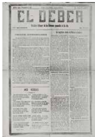
Semanario El deber , impreso en El Hierro a partir de 1922