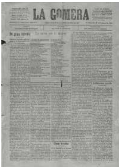
La Gomera : órgano defensor de los intereses generales del país (San Sebastián de La Gomera, 27 de febrero de 1926), primer periódico impreso en esta isla

(17) ACOSTA PADRÓN, Venancio: La prensa en El Hierro , La Laguna, Centro de la Cultura Popular Canaria, 1997, pp. 45-126; QUINTERO REBOSO, Carlos: «"El deber" y "La voz de El Hierro"», La voz de El Hierro , n. 91 (Frontera, 2014), pp. 5-7.