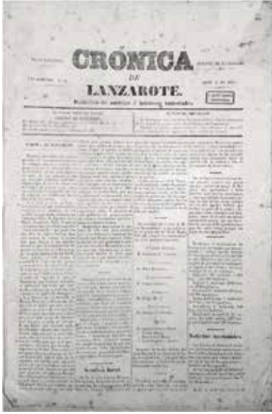
Ejemplar de Crónica de Lanzarote (Arrecife, 1861), primera publicación seriada de Lanzarote

(17) ACOSTA PADRÓN, Venancio: La prensa en El Hierro , La Laguna, Centro de la Cultura Popular Canaria, 1997, pp. 45-126; QUINTERO REBOSO, Carlos: «"El deber" y "La voz de El Hierro"», La voz de El Hierro , n. 91 (Frontera, 2014), pp. 5-7.