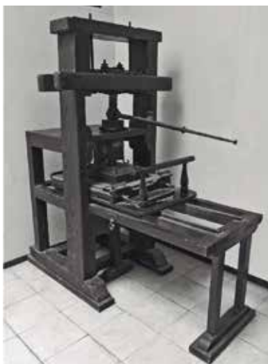
Imprenta de la Real Sociedad Económica de Amigos del País de Las Palmas de Gran Canaria (1800)