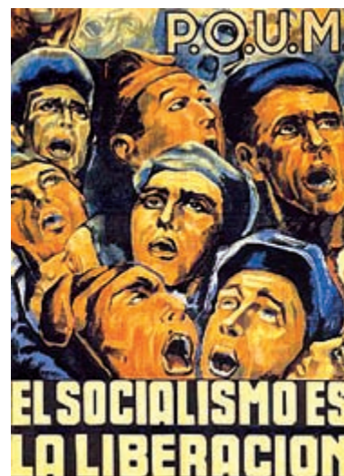
Cartel del P.O.U.M.

Fue la creación de dos hombres, Manuel Azaña, líder del Partido Republicano de Izquierda e Indalecio Prieto, líder centrista del Partido Socialista. Ambos, pragmáticos moderados, estaban empeñados en asegurar que las divisiones que llevaron a la derrota electoral de 1933 no se repitieran. Azaña trabajó