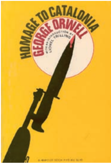
Portada de Homenaje a Cataluña .

intensamente para reunificar a los diversos pequeños partidos Republicanos, mientras que Prieto, desde el exilio en Bélgica, se concentró en contrarrestar el extremismo revolucionario de la izquierda Socialista de Largo Caballero. Azaña se dirigió a multitudes en varias reuniones al aire libre en Bilbao, Valencia y Madrid, en la segunda mitad de 1935. El sólido entusiasmo por la unidad de la izquierda mostrado por los cientos de miles que acudieron, ayudó a convencer a Largo Caballero a abandonar su oposición a una renovación de la coalición electoral Republicana-Socialista de 1931, la cual eventualmente fue conocida como el Frente Popular. Al mismo tiempo, el pequeño Partido Comunista de España, impulsado por la ansiedad de Moscú por un entendimiento con las democracias en contra de las ambiciones agresivas del Tercer Reich, utilizó su influencia con Largo Caballero a favor del Frente Popular. Ellos sabían que para darle el sabor más proletario que él quería, Largo Caballero insistiría en su presencia. De esta manera, los Comunistas encontraron un espacio en un frente electoral que, en contra de lo que decía la propaganda derechista, no era en España, una creación del Komintern aunque sí tomó el nombre de Frente Popular, acuñado en el VII Congreso del Komintern en agosto de 1935. La izquierda y el centro cerraron filas en base a un programa de amnistía para presos, de reformas básicas en lo social y en la educación y libertades sindicales.