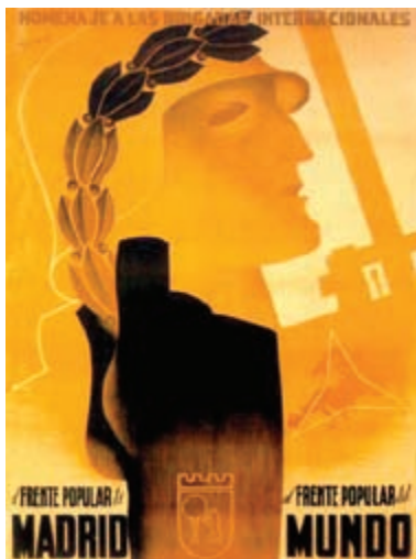
Cartel de las Brigadas Internacionales.

Los voluntarios que fueron, estaban entre los primeros en Europa en hacer algo respecto a la amenaza fascista. Refugiados italianos, alemanes y austriacos vieron en la Guerra Civil Española su primera oportunidad de luchar contra el fascismo. Voluntarios franceses (el contingente más numeroso) británicos y norteamericanos fueron a España preocupados por lo que significaría una derrota de la República Española para el resto del mundo. Fueron los primeros en el campo de una guerra que duraría hasta 1945. Estos “antifascistas prematuros” fueron vilipendiados a su regreso a Gran Bretaña, tratados como “la escoria de la tierra” en los campos de internamiento franceses o considerados como peligrosos y antiamericanos en los Estados Unidos. A pesar de esto, los voluntarios supervivientes lucharon en la Segunda Guerra Mundial –después de todo, la guerra antifascista era su guerra. No están resentidos por la falta de reconocimiento universal por su contribución a la derrota del fascismo. Están, sin embargo, indignados ante la creencia, alimentada por el éxito de Tierra y libertad de Loach, de que la lucha de los brigadistas y del pueblo español no fue una lucha contra el fascismo español y sus aliados alemanes e italianos, sino más bien parte de una guerra civil intestina izquierdista en el cual el enemigo central era el Partido Comunista.