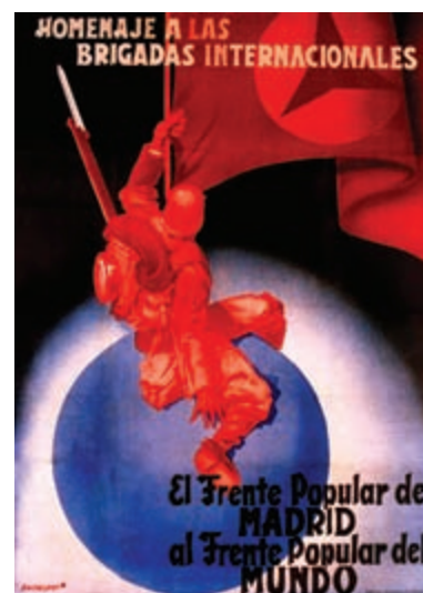
Cartel Homenaje a las Brigadas Internacionales.

La reacción inicial de la Unión Soviética había sido de profunda vergüenza. El Kremlin no quería que los acontecimientos en España socavaran sus planes minuciosamente preparados para una alianza con Francia. Sin embargo, para mediados de agosto, era aparente que ocurriría un desastre aún mayor si caía la República Española. Eso alteraría severamente el equilibrio del poder Europeo, dejando a Francia con tres estados fascistas en sus fronteras. Eventualmente, se decidió enviar ayuda a regañadientes. Los tanques y aviones que llegaron en otoño eran, junto a la llegada de las Brigadas Internacionales, para salvar Madrid en noviembre de 1936. Sin embargo, también serían utilizados para justificar la intervención de Hitler y Mussolini. La motivación de ambos era principalmente socavar la hegemonía Anglo-Francesa en las relaciones internacionales, pero estaban seguros de encontrar a un interlocutor amable en Londres cuando decían estar combatiendo al bolchevismo.