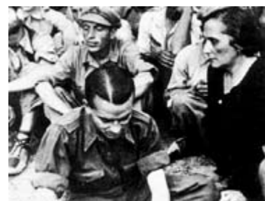
Pasionaria con milicianos.

En 1986 el Gobierno Español concedió la ciudadanía a los miembros supervivientes de las Brigadas Internacionales que lucharon contra el fascismo durante la Guerra Civil. Fue un gesto de gratitud bien recibido pero tardío y en cumplimiento de las sentidas palabras pronunciadas por la dirigente comunista Dolores Ibarruri, “La Pasionaria” en el desfile de despedida de los Brigadistas, celebrada en Barcelona el 29 de octubre de 1938. Su conmovedor discurso finalizó así: “Motivos políticos, motivos de estado, lo bueno de esa misma causa por la que ustedes ofrecieron su sangre con generosidad ilimitada, les envía a algunos de ustedes de regreso a sus países y a algunos a un exilio forzoso. Pueden ir con orgullo. Sois historia. Sois leyenda. Sois el ejemplo heroico de la solidaridad y universalidad de la democracia... Nosotros no les olvidaremos; y cuando del árbol de olivo de la paz broten sus hojas, entrelazadas con los laureles de la victoria de la República Española, ¡vuelvan! Vuelvan a nosotros y aquí encontrarán una patria”. Se ha tardado más de sesenta años, pero los españoles no son los únicos en retrasarse en dar las gracias.