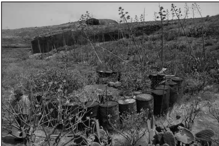
Pozos de Arucas.