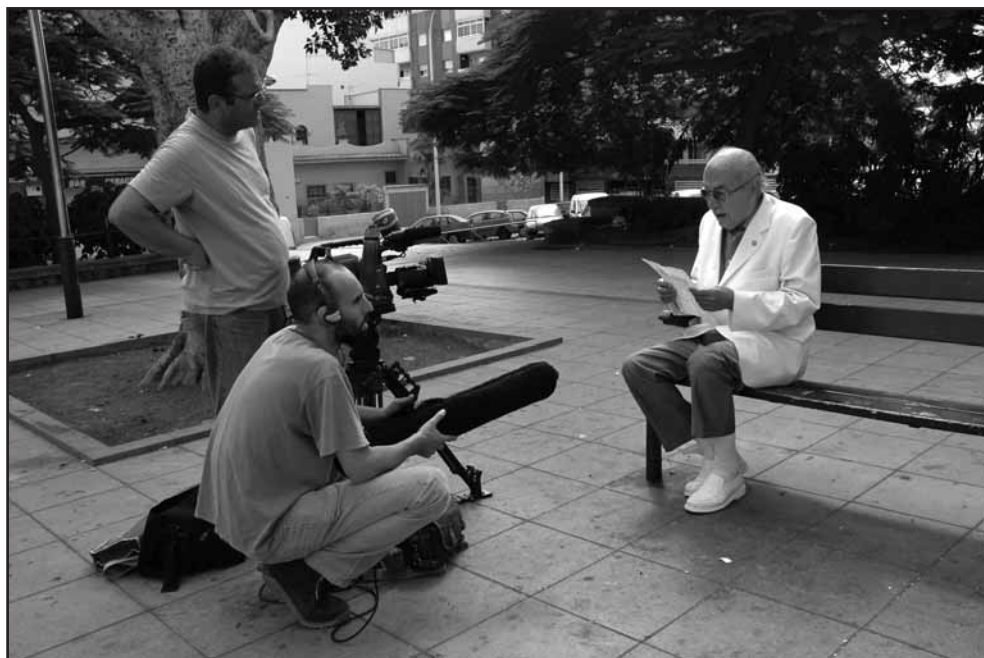
Grabando Memoria Silenciada .

el Partido Socialista, viene a honrar —un poco tarde— la memoria de las víctimas de Franco y sus familiares. Ésta puede ser la última oportunidad para el reconocimiento de los que vivieron el doloroso exilio interior (Javier Valenzuela, 2002), marcado por el miedo, el silencio y la marginación en el mejor de los casos o la cárcel, las torturas, los trabajos forzados y las ejecuciones en el peor. Provoca una profunda sensación de impotencia e incapacidad al constatar, casi a diario, la desaparición física de los informantes, de los testigos y/o protagonistas del lado oscuro de la historia oficial, la contra memoria del franquismo, la historia que ha sido relegada a la marginalidad, al desprecio o la negación.