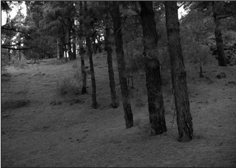
Pinares de Fuencaliente