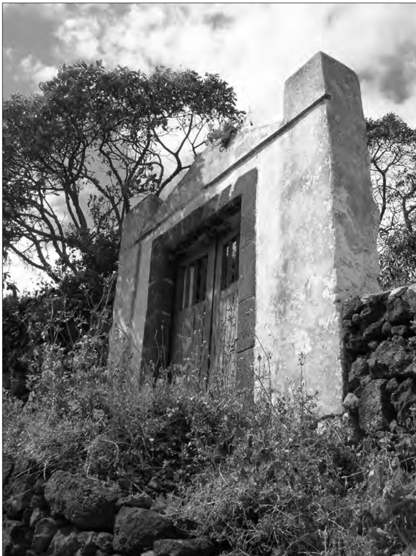
Hacienda en el barranco de Aduares en Breña Alta