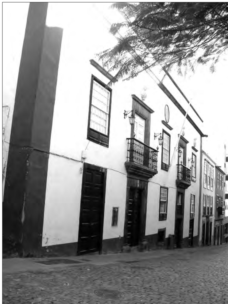
En el solar en el que habitó el licenciado don Pedro de Campos, donde tenía su librería, se levantó un nuevo inmueble en el siglo XVIII

belhoco con lo a ella Perteneciente lindando por arriua y por un lado camino Real que ua a dar a la fuente del quintero y por auajo y por el otro lado con biña de los herederos del capp an gregorio Roberto [...] unas casas altos y bajos sitas en esta çiu d en la calle rreal de la somada que son las casas que disen de alarcon».