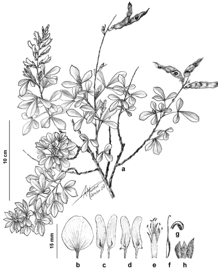
Figura 2.- Icón: Teline stenopetala (Webb & Berthel.) Webb & Berthel. subsp. santoantoi subsp. nov. a) rama florífera; b) estandarte; c) alas; d) quilla; e) androceo; f) gineceo; g) estigma; h) cáliz.