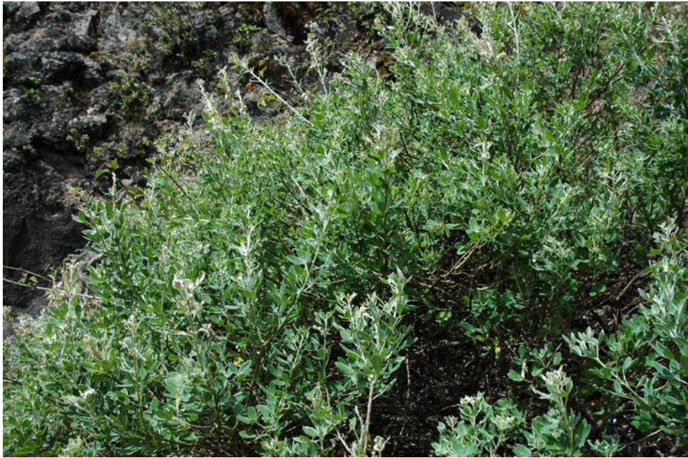
Figura 3.- Teline stenopetala (Webb & Berthel.) Webb & Berthel. subsp. santoantaoi , subsp. nov. Arriba: ambiente donde crece la planta, pared exterior de Cova de Paul, en los riscos altos de esta Ribeira. Abajo: detalle de una planta.