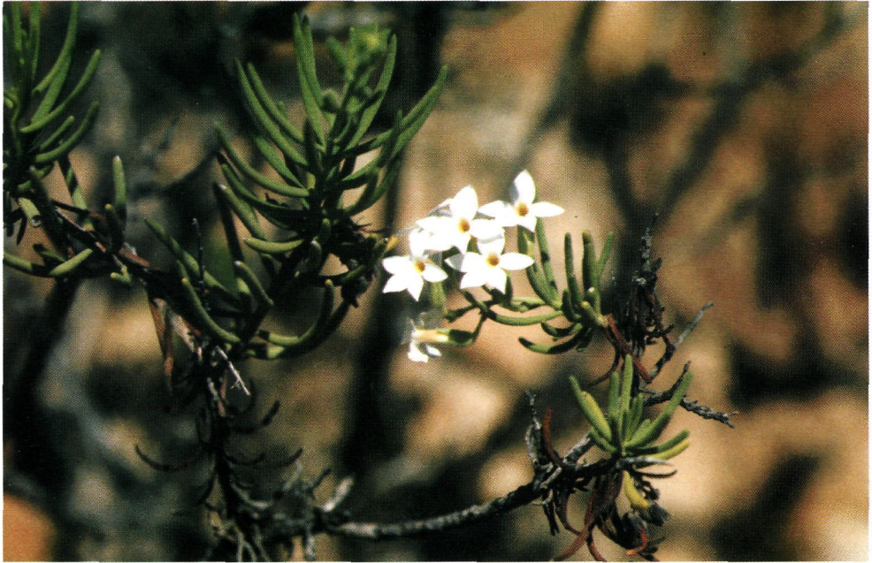
Figura 1.- Campylanthus salsoloides Roth var. leucantha Sventenius

archipiélago, a excepción de La Palma, en donde no ha vuelto a encontrarse tras ser citado por Burchard (SANTOS, 1983), y en El Hierro, donde al parecer no ha sido hallado (HANSEN & SUNDING, 1993). Por el contrario, la variedad leucantha es sumamente rara y su distribución conocida hasta la fecha se restringía a un par de localidades de las islas de La Gomera (SVENIENIUS, 1969) y Gran Canaria (KUNKEL, 1972; WILDPRET & BARQUÍN, 1975). En efecto, Sventenius ( op. cit. ) la citaba para San Sebastián de La Gomera y alrededores, considerándola muy rara. A su vez, Kunkel ( op. cit. ) la encontró pocos años más tarde en el Barranco de Moya, en Gran Canaria, a 120 m s.m., junto con la variedad típica. Por otro lado, WILDPRET & BARQUÍN ( op. cit. ) consideraban que un material procedente del barranco de Guayadeque, también en Gran Canaria, pertenecía en principio a C. salsoloides var. leucantha .