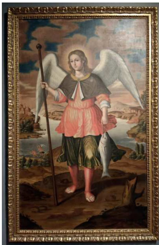
Fig. 6. Atribuido a Nicolás de Medina, San Rafael Arcángel , segundo cuarto del siglo XVIII. Museo Municipal de Bellas Artes de Santa Cruz de Tenerife.

Esto es lo que cabe plantear respecto a la figura de san José incluida en un pequeño óleo sobre lienzo inédito para la historiografía isleña puesto a la venta en dos ocasiones, en 2019 y 2020, por la casa Lefebre Subastas de Bogotá como obra de Cristóbal Hernández de Quintana 20 , atribución que suscribimos. Se trata de una Presentación del Niño –episodio al que corresponde la fiesta de la Candelaria– de formato apaisado (82 x 105 cm), que incluye en su parte superior una inscripción informativa sobre las indulgencias concedidas en 1733 por Pedro Manuel Dávila y Cárdenas, obispo de Canarias, a quienes rezaran ante esta imagen por las ánimas del purgatorio. La Virgen y el Niño –que siguen un modelo difundido por la estampa– así como el sacerdote Simeón remiten inequívocamente al repertorio de Quintana, pero la semejanza no es tan clara en la figura de san José, que fuera de este contexto plástico tal vez no habríamos considerado de su mano.