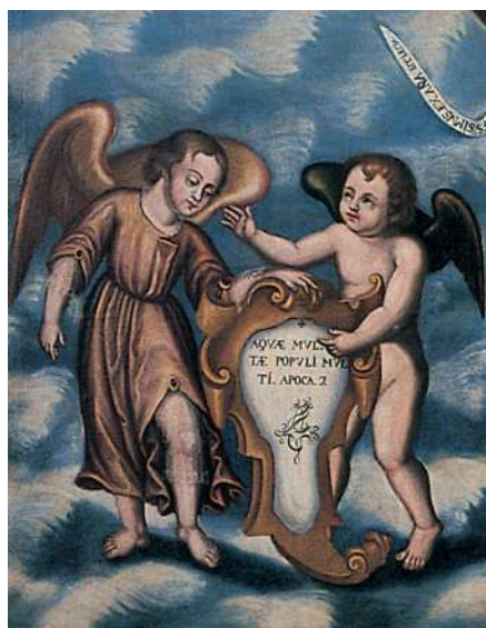
Fig. 8. Nicolás de Medina, Nave de la Iglesia (detalle), h. 1730. Iglesia de Santa María, Betancuria Fuerteventura.

En este mismo ámbito de la querencia por elementos escriturarios recopilamos varios trazos caligráficos ornamentales a modo de rúbrica dispuestos en cartelas –Nave de la Iglesia (Figura 8), panel de versos piadosos de La Ampuyenta (Figura. 5), cuadro del refectorio de las Catalinas (Figura 7)–, en filaterias –púlpito de La Ampuyenta (Figura 4)– y en un papel fingido que contiene el año 1737 en la Santa Teresa (Figura 2) del retablo mayor de esa misma ermita. Todos estos detalles pueden indicar un gusto personal y deben tenerse en cuenta ante posibles nuevas propuestas de catalogación.