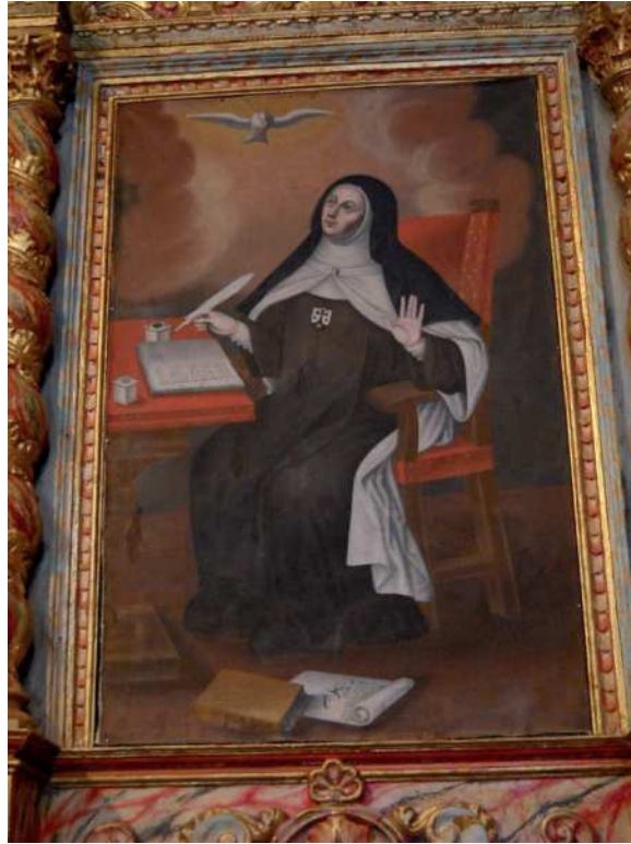
Fig. 2. Atribuido a Nicolás de Medina, Santa Teresa de Jesús , 1737. Ermita de San Pedro de Alcántara, La Ampuyenta, Fuerteventura.