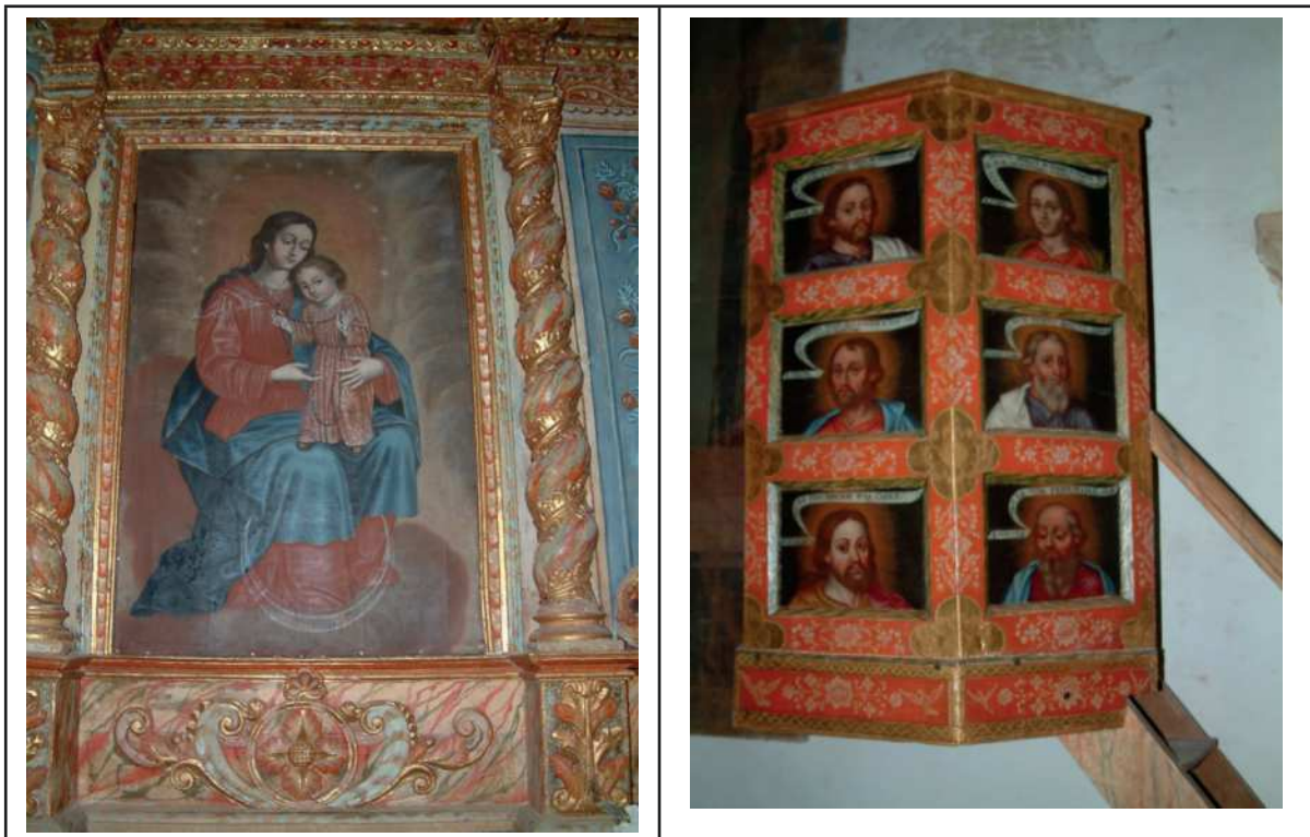
Fig. 3 y 4. Atribuido a Nicolás de Medina, Virgen con el Niño , ¿1737? y Púlpito , ¿h. 1737?. Ermita de San Pedro de Alcántara, La Ampuyenta, Fuerteventura.