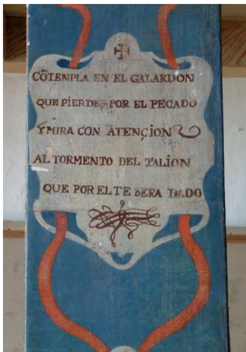
Fig. 5. Atribuido a Nicolás de Medina, Versos piadosos (detalle), ¿h. 1737? Ermita de San Pedro de Alcántara, La Ampuyenta, Fuerteventura.