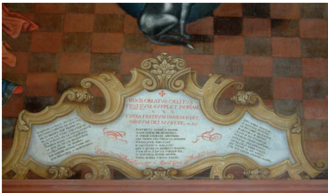
Fig. 7. Atribuido a Nicolás de Medina, Comunidad de dominicos servida por ángeles (detalle), segundo cuarto del siglo XVIII. Monasterio de Santa Catalina de Siena, San Cristóbal de La Laguna, Tenerife.

En este punto llamamos la atención sobre la presencia en varias obras de Medina de cartelas o tarjetas que contienen inscripciones. No se trata, obviamente, de algo propio o privativo, pero tampoco es muy frecuente en las islas y podría valorarse como un elemento al que fue aficionado. Lo traemos aquí porque en dos de las dos últimas obras de Quintana –el retrato del Cristo de La Laguna, que le atribuimos, en su antigua cruz de madera, y la Inmaculada de Las Palmas– incluyó sendas cartelas, sencillas, cuyos perfiles no dejan de recordar a las de Medina. Además de en la Nave de la Iglesia, las incluiría en un panel vertical en La Ampuyenta (Figura 5), en el Santo Domingo de Guzmán del Monasterio de Santa Catalina de La Laguna y en el cuadro del refectorio este mismo convento (Figura 7).