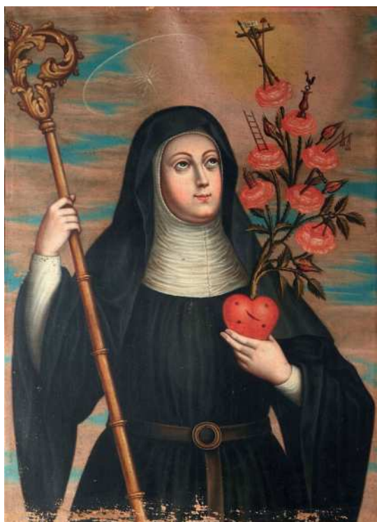
Fig. 9. Atribuido a Nicolás de Medina, Santa Florentina , segundo cuarto del siglo XVIII. Monasterio de Santa Catalina de Siena, San Cristóbal de La Laguna, Tenerife.

de Santa Catalina de La Laguna: una Santa Florentina de tamaño algo mayor (Figura 9), cuya iconografía invita a suponer que le fue encargado por alguna religiosa de la comunidad 35 , para la que suponemos que pintó el gran cuadro del refectorio. También un Santo Tomás y una Santa María Magdalena –dos de los patronos de la Orden de Predicadores– que parecen formar pareja y comparten reducidas dimensiones, cálido colorido, dibujo preciso y guarniciones con motivos ornamentales dorados sobre fondo encarnado. Por dimensiones y sentido preciosista (tanto la pintura como el marco) pueden vincularse a una Inmaculada Concepción del Museo Iberoamericano de Artesanía de La Orotava 36 , cuya composición remite a otras dos obras que suponemos suyas, una Candelaria en colección particular de La Laguna 37 y la Asunción de Betancuria. En última instancia todas recuerdan a la Inmaculada del canónigo Calzadilla de la Catedral de las Palmas, una de las últimas realizaciones de Quintana. En este mismo grupo ha de incluirse el San Francisco que, procedente de un ámbito doméstico, se expone ahora en el Museo de Arte Sacro El Tesoro de la Concepción de La Orotava 38 .