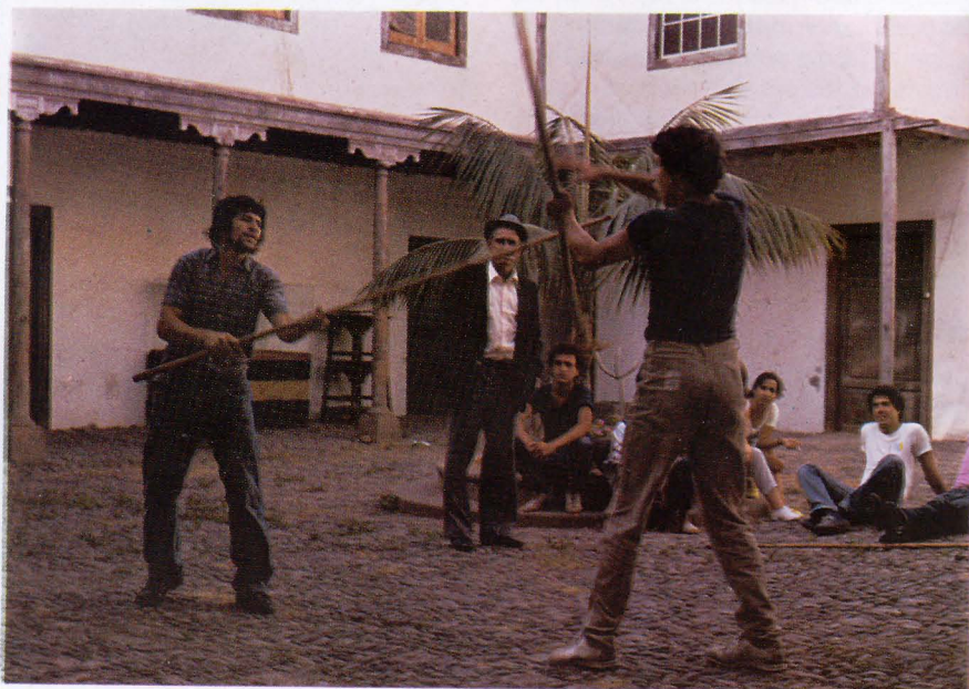
Ataque al costado y defensa con cambio de mano