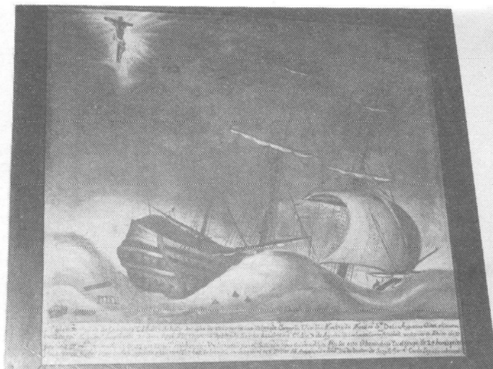
Pieza correspondiente al santuario del Cristo del Planto, en la capital palmera. El milagro tuvo lugar en 1757.