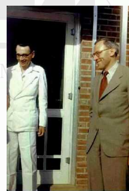
Gödel y Morgenstern

Cuando llegó la tan esperada cita, Einstein y Morgenstern intentaron desviar la atención de Gödel para que no pensara en lo que le rondaba la cabeza y evitar así que se le escapara algún chiste inconveniente o alguna anécdota fuera de lugar: confiaban en que se limitaría a presentarse, dar las respuestas de rigor y los tópicos resabidos y marchar con la nacionalidad bajo el brazo. El siguiente relato de John Casti sobre cómo discurrió la entrevista confirma que las sospechas de los dos testigos no eran infundadas: