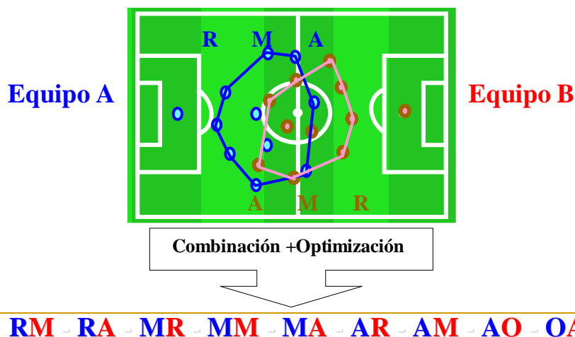
Figura 3. Relación de los contextos de interacción (CI).

La primera de las letras corresponderá a la configuración espacial de uno de los equipos y la segunda al otro, y siempre, con relación a la ubicación del balón. Esto permite contextualizar las conductas que jugadores y equipos realizan en el fútbol (figura 4).