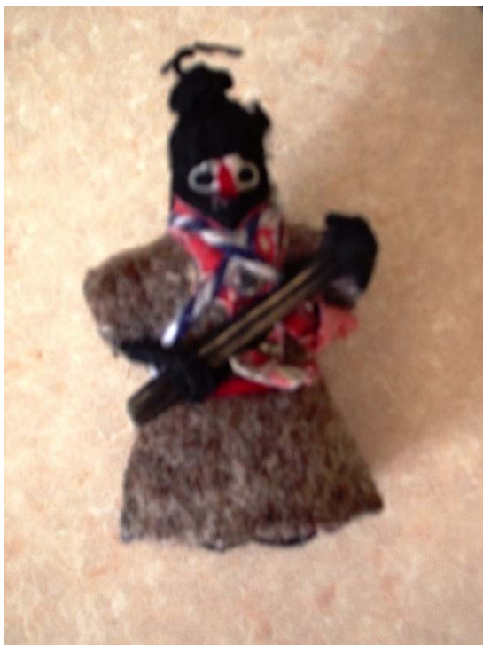
Imagen 1. Souvenir Zapatista.

Nuevo a la entrada a San Cristóbal, donde, de acuerdo con el mito popular, los zapatistas escaparon internándose en una cueva después de la confrontación con el ejército: “Hubo muertos tanto zapatistas como del ejército pero muchos se escondieron en la cueva donde ya no hay luz... después salieron cuando ya no había nadie” (soldado guardia del parque).