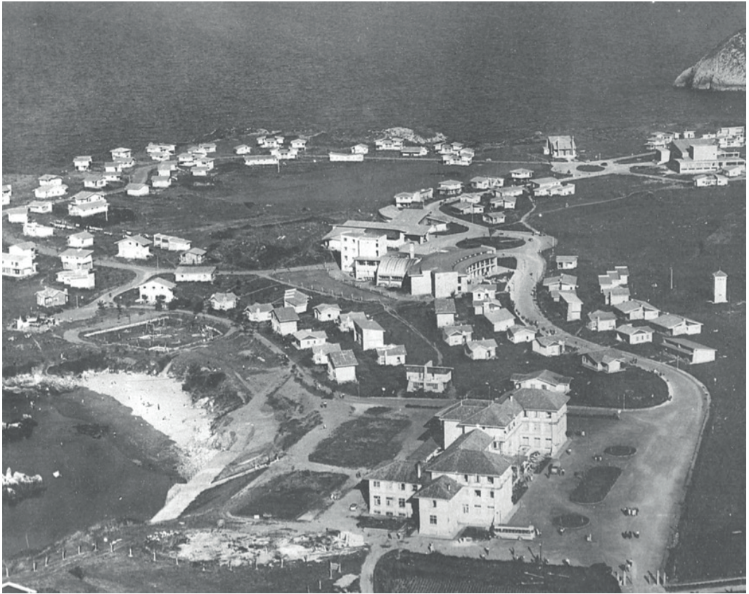
Figura 6: Ciudad Residencial de Perlorá.