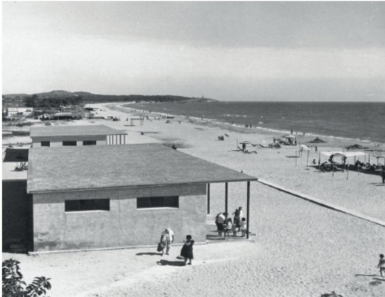
Figura 1: La clase ociosa, ciudad de vacaciones de Tarragona.