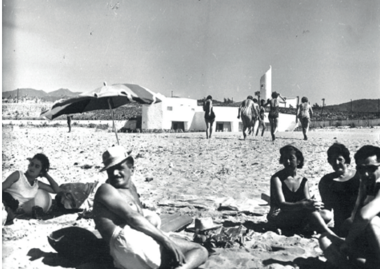
Figura 2: El deseo de la orilla, ciudad de vacaciones de Marbella.

través de un recorrido de algo menos de una centuria en el que asistimos al despertar del interés, primero el de las clases pudientes, después el de las clases proletarias, por la costa, en un proceso tan largo y lento como el de la consecución del derecho a las vacaciones pagadas al que se ha hecho referencia.