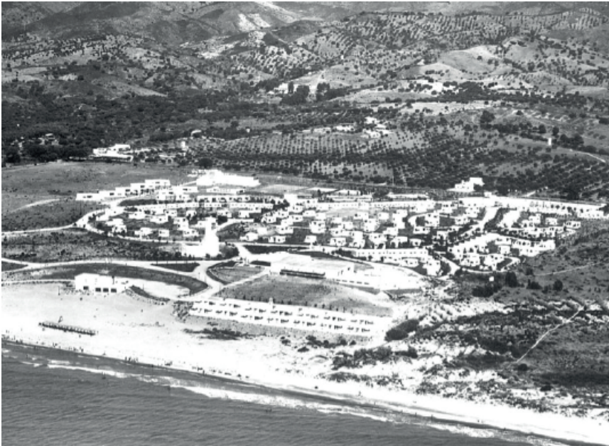
Figura 5: Ciudad Sindical de Marbella.