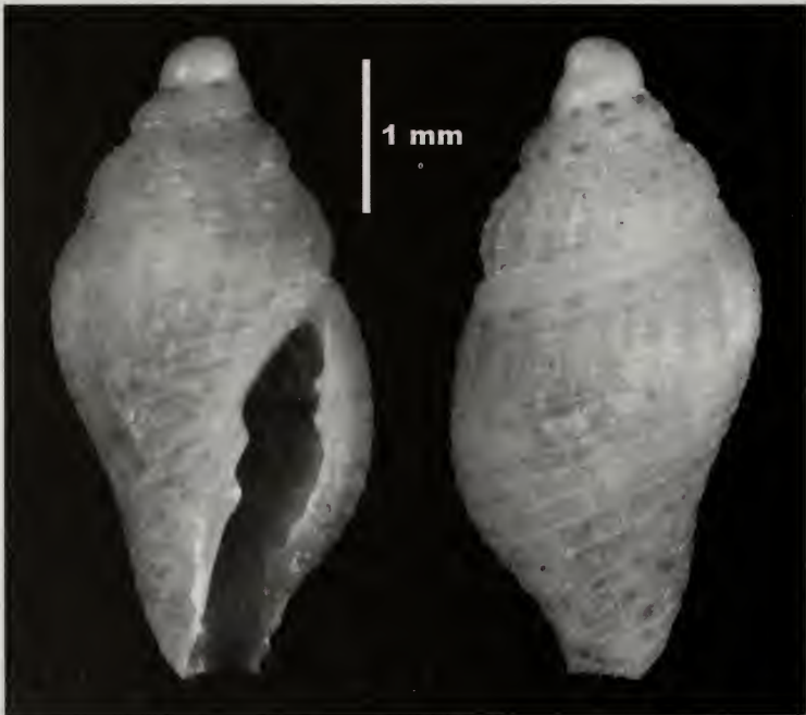
Figura 4.- Mitrolumna selene , especie nueva, holotipo.

Descripción: Concha bicónica, de tamaño pequeño, poco engrosada, de apariencia frágil y escultura no cancelada. Protoconcha de una vuelta grande y globosa, con un núcleo relativamente pequeño. Teleoconcha de algo más de tres vueltas, convexas y algo redondeadas, dándole a la concha su aspecto globoso. La escultura está formada por costillas axiales bajas, casi más anchas que los espacios intercostales que las separan, unas 12 en la última vuelta, cortadas por numerosos cordones espirales, hasta 20, que van desde la sutura a la base de la concha en la última vuelta, casi subiguales en desarrollo. Abertura suboval alar-