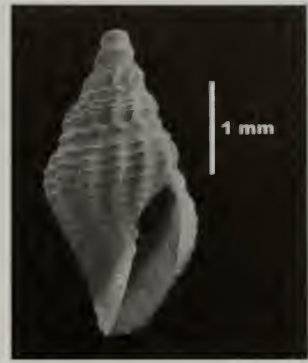
Figura 3.- Mitrolumna erycinella , especie nueva, vista al MEB.

Material examinado: Varios ejemplares recolectados vivos y numerosas conchas vacías, encontradas en la Cueva de Yemayá (localidad tipo), las Cuevas de Pedro y El Encanto, María la Gorda, península de Guanahacabibes, Pinar del Río, Cuba, entre 20 y 35 m de profundidad. Holotipo (4'75 mm de largo y 2',1 mm de ancho) depositado en el Instituto de Ecología y Sistemática, La Habana, Cuba. Paratipo (4'25 mm de largo y 2 mm de ancho) depositado en el Museo de Ciencias Naturales de Tenerife, islas Canarias, España.