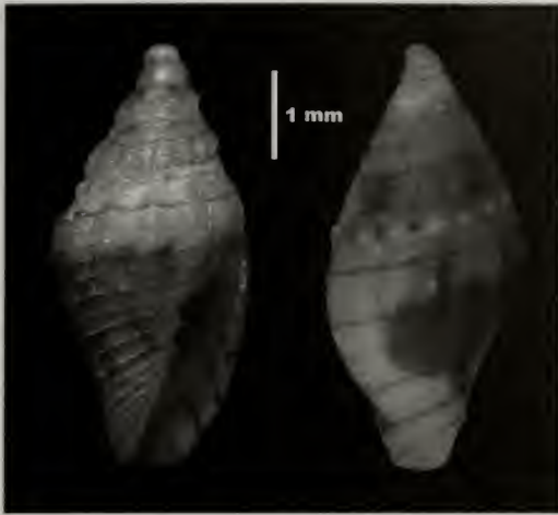
Figura 2.- Mitrolumna erycinella , especie nueva, holotipo.