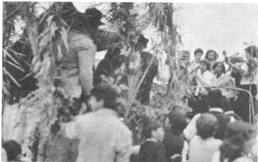
Los novios llegan en una carreta.