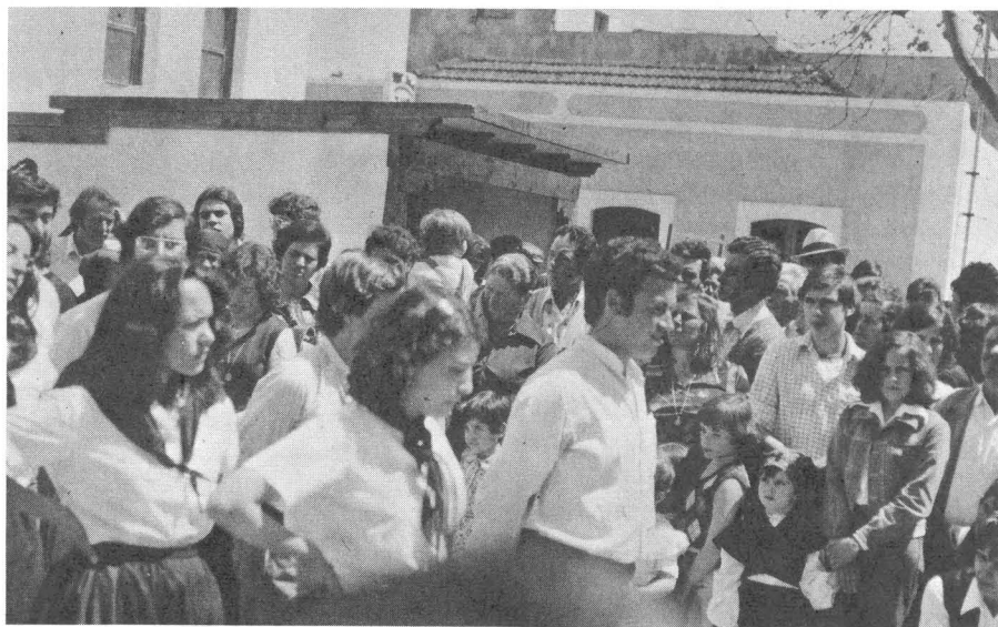
Un grupo folklórico, durante la fiesta.

Por la tarde, en la iglesia de Montaña Alta se celebró una