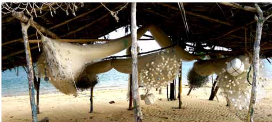
Figura 4. Cartão Fotográfico. Distrito de Galos, Galinhos/RN – Brasil

As oficinas de fotografia e voz realizadas através dos seis encontros culminaram em duas exposições realizadas respectivamente na localidade sede do município de Galinhos, em uma pousada, e na praça central Tancredo Neves, no distrito de Galos. Como resultado final das oficinas, planejamos um produto palpável que, de acordo com os critérios de simplicidade e significância, transmitisse a experiência vivenciada pelos autores/participantes do projeto para os visitantes das exposições. Nesse sentido elaboramos, a partir de uma seleção das fotografias feitas pelos jovens, uma espécie de cartão fotográfico, ao modelo de um cartão postal, mas em papel fotográfico. Os cartões tiveram forte adesão ao serem distribuídos nas duas sessões expositivas (Figura 4).