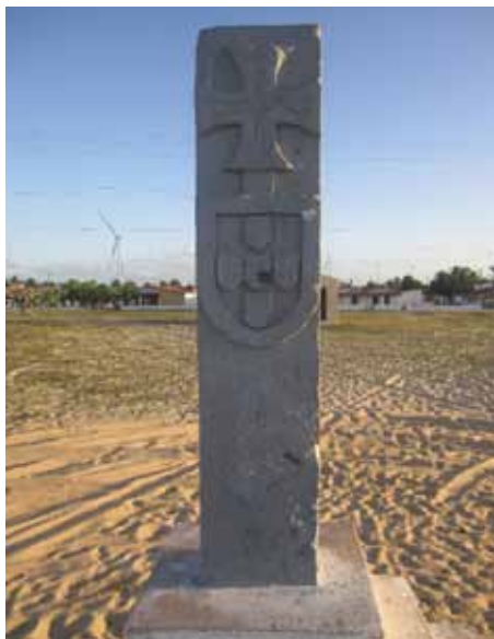
Figura 7. Réplica do Marco Quinhentista