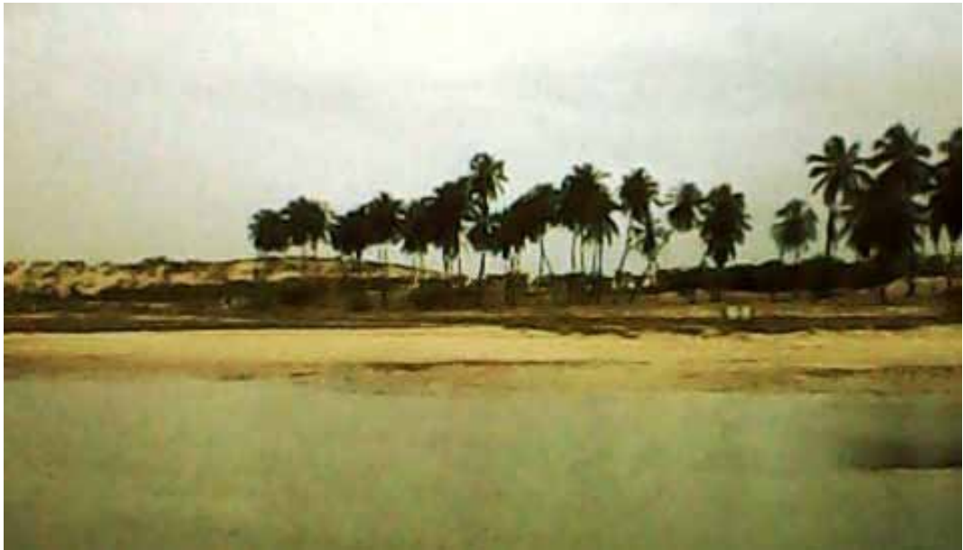
Figura 2. Distrito de Galos, Galinhos/RN – Brasil

Fonte: Exposição fotográfica “Pescar de outra maneira”/Projeto Photovoice. (Técnica empregada: exposição com celular simples)