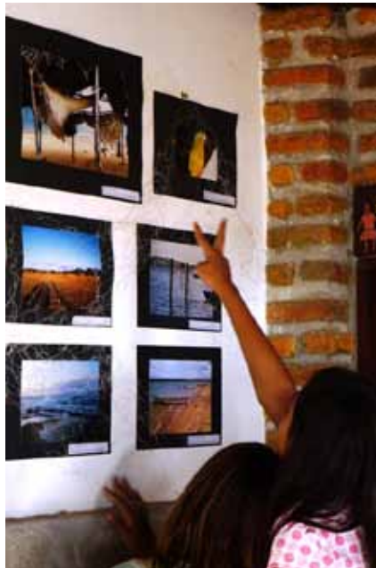
Figura 5. Exposição Fotográfica “Pescar de outra maneira”. Galinhos/RN – Brasil

Em relação às exposições, a primeira ocorreu, como mencionado, na pousada na sede do município de Galinhos. A escolha se deveu à ideia que tínhamos em mente, mas ainda em incubação, de dar visibilidade aos recursos turísticos locais, já que a pousada recebe diariamente turistas de diferentes origens. Mesmo havendo uma circulação internacional no município, os contatos ficam muito limitados aos serviços prestados pelos residentes aos visitantes. A experiência realizada pelo projeto Photovoice “Pescar de outra maneira”, através da primeira exposição na sede de Galinhos, proporcionou um contato de proximidade e interação dos jovens fotógrafos com os turistas (Figura 5) de várias partes do país e do exterior, que por sua vez levaram consigo cartões fotográficos disseminando a experiência e as imagens das belezas naturais e da cultura de Galinhos.