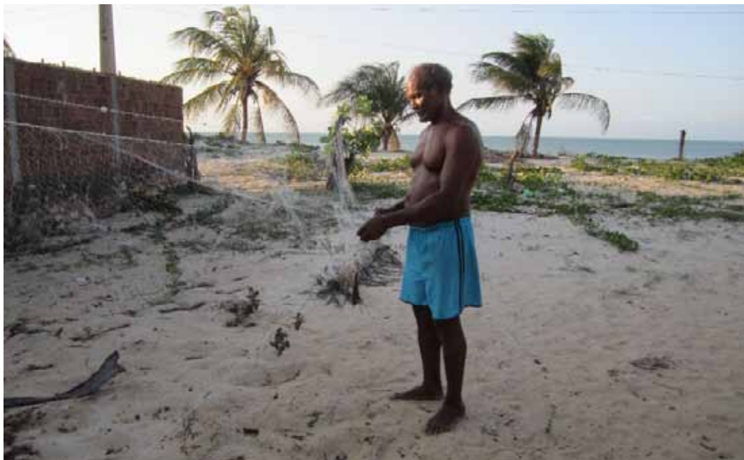
Figura 6. Pescador e pai da participante tratando a rede de pesca

Apresentaremos dois exemplos de fotografia produzidas pelos participantes. A figura 6 mostra um pescador tratando a rede de pesca, preparando-se para mais uma saída ao mar. Quando questionada sobre a razão da escolha do tema, a autora da imagem afirmou se tratar do próprio pai, que pesca artesanalmente desde criança, e que construiu sua família a partir dos proventos advindos dessa atividade. A pesca tradicional, que envolve o saber-fazer do jangadeiro, suas embarcações, técnica de navegação, histórias e até mesmo a culinária, se coloca então como um forte recurso turístico da região, visto que os dois elementos envolvidos, cultura local e litoral, são reconhecidamente formadores de oferta turística, caso sejam preparados e arrançados como tal. Lembramos que recurso turístico, da forma como trabalha esse artigo, é algo que existe em si, de forma autônoma, mas que pode, diante de adaptações e preservando suas características identitárias, ser formatado como atrativo e incluído na cadeia produtiva do turismo.