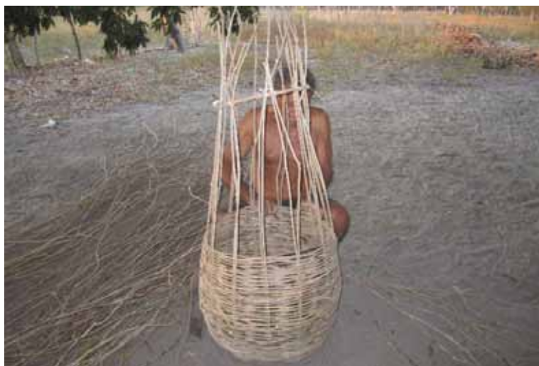
Figura 8. Artesão e pai da participante trabalhando com cestaria

A figura 8 mostra um tipo de trabalho muito aproveitado pelo turismo, o artesanato. Quando indagada acerca das circunstâncias e motivações da fotografia, a autora revelou que o homem trabalhando com os cipós é seu pai, que produz diversos tipos de cestos, muitos dos quais utilizados na própria pesca. A matéria prima é coletada na região, e a técnica de cestaria segue as instruções transmitidas, de forma oral, pela família. A fotografia evidencia também aspectos étnicos, já que Acauã tem na maioria de sua população descendência indígena.