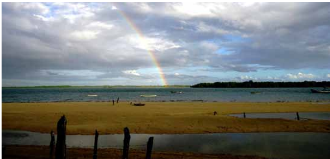
Figura 3. Distrito de Galos, Galinhos/RN – Brasil

Fonte: Exposição fotográfica “Pescar de outra maneira”/Projeto Photovoice. (Técnica empregada: exposição com câmera Sony cyber shot )