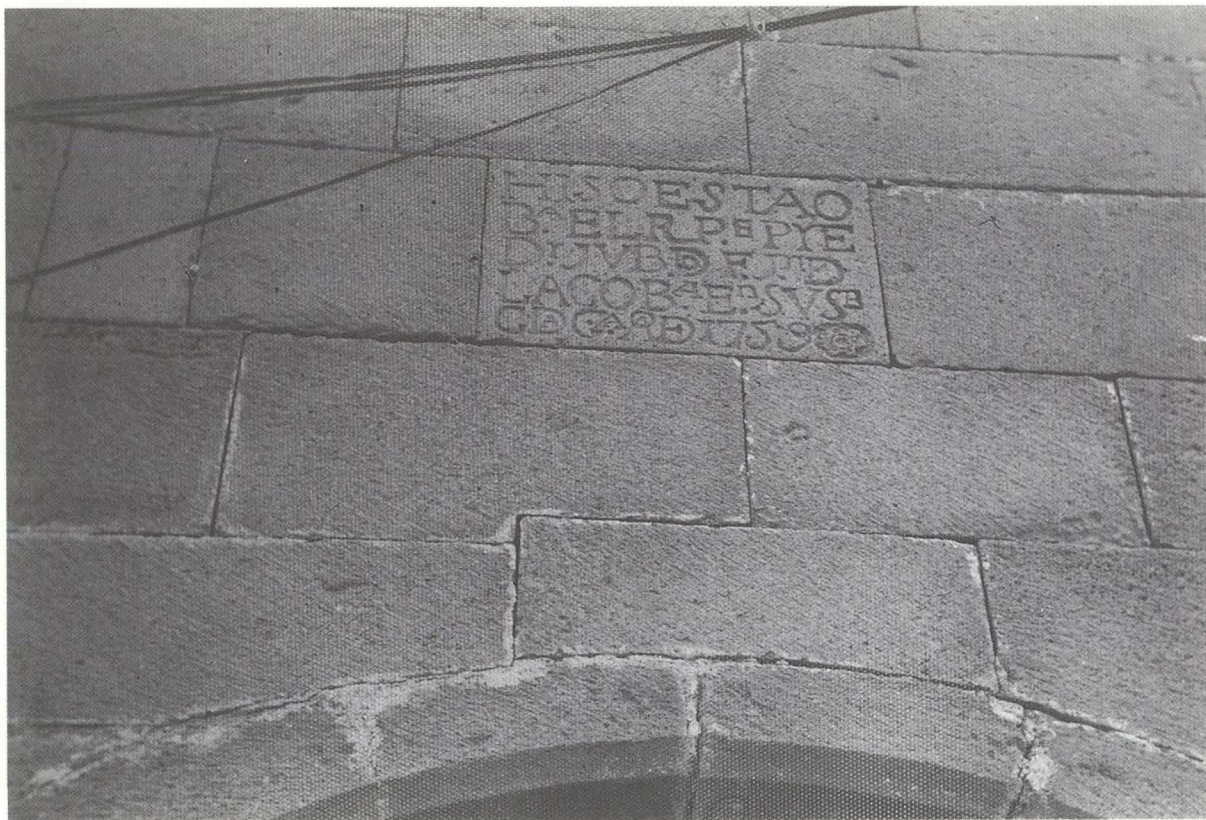
Lámina IV: Inscripción alusiva a la construcción —1759— de lo que fuera portería conventual.