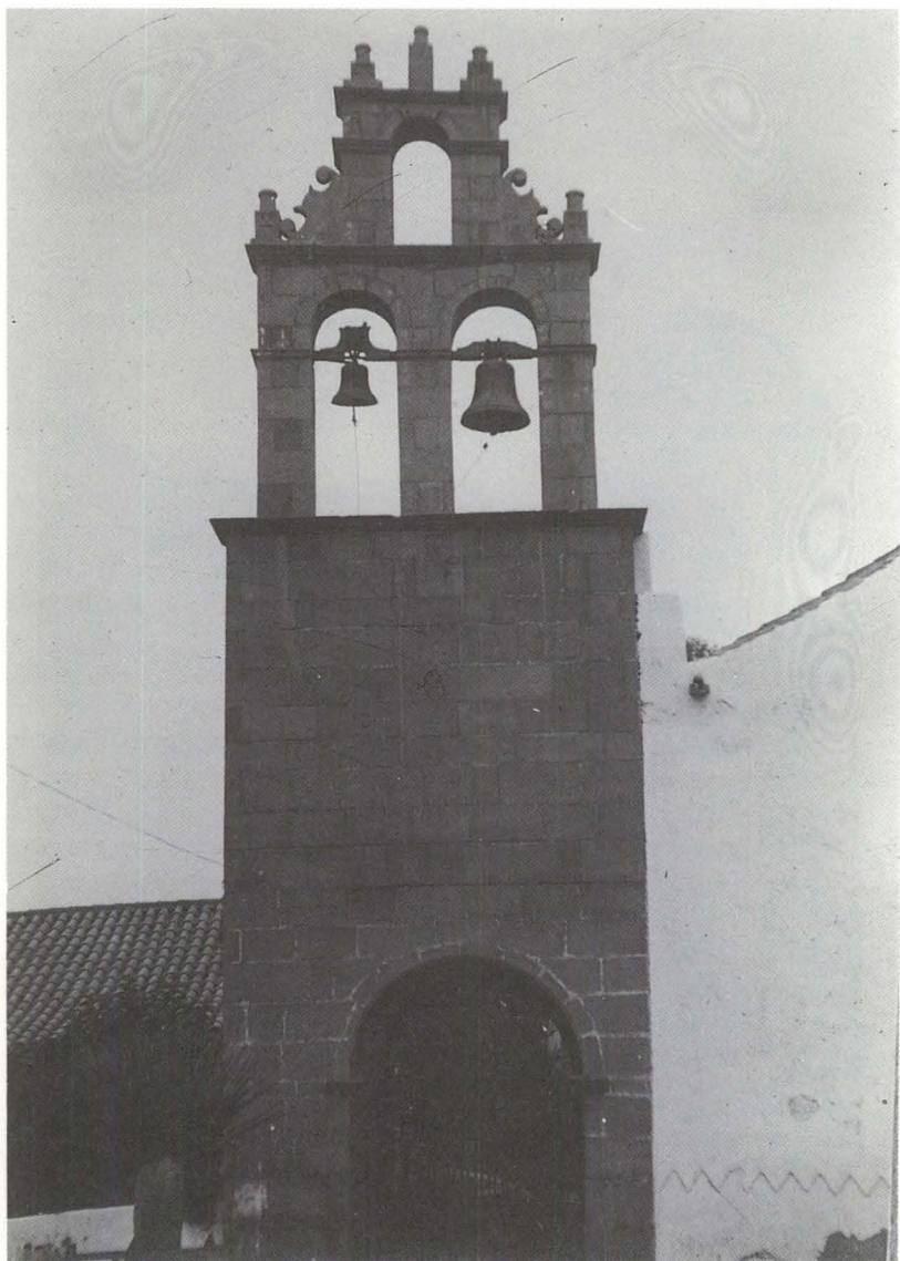
Lámina II: Portería del desaparecido convento franciscano de Telde, 1759. Encima espadaña colocada en 1981.