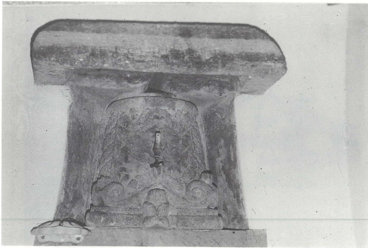
Lámina I: Capitel conservado en San Francisco de Telde, presumiblemente de la ermita de Santa María de la Antigua.