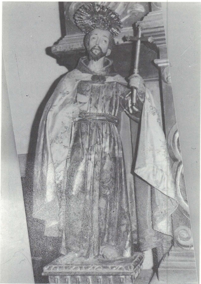
Lámina III: Escultura de San Francisco de Asís, hacia 1652.