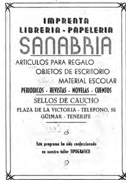
Propagandas de la «Librería-Papelería Sanabria» en 1948, en la plaza de San Pedro, y de la «Imprenta Librería-Papelería Sanabria» en 1954, tras su traslado a la plaza de la Victoria