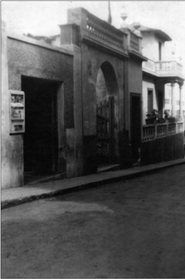
Primera sede de la librería-imprensa Sanabria, en la Plaza de San Pedro