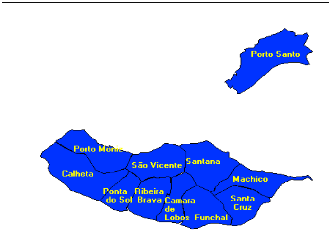
Mapa 1 - Concelhos da Região Autónoma da Madeira