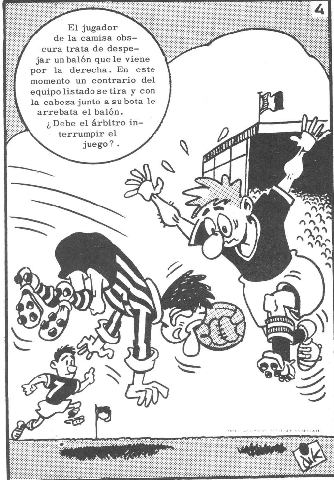
Soluciones en la pág. 11