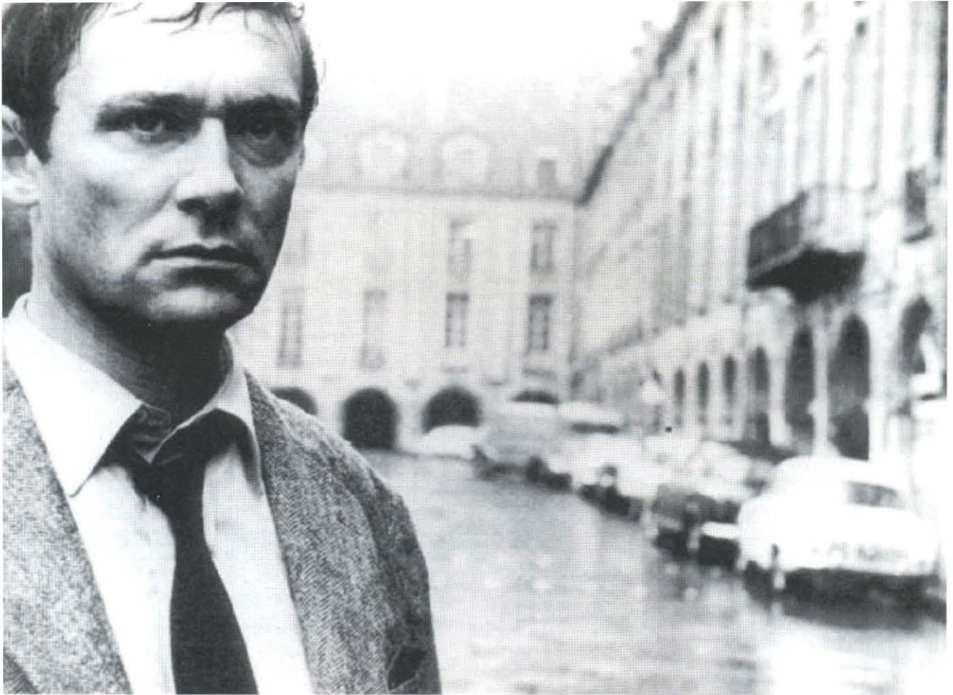
Fuego fatuo , F. Fellini

embargo, de estar marcada por el tedio y el hastío. La inesperada muerte de un familiar le hará rico y le obligará a trasladarse al campo donde deberá gestionar su fortuna. Allí conocerá a la joven Tatiana y al idealista Lenski, seres ambos de tal pureza que inevitablemente caerán en desgracia al contacto con el alma turbulenta del protagonista. Y hasta aquí, aparentemente, nada que se aparte en esencia del prototipo de héroe romántico con su carga de cinismo y fatalidad. La peculiaridad de nuestro héroe es su progresiva conversión, diríase que en una especie de camino de perfección, en un hombre lleno de autocompasión y arrepentimiento, que siente remordimientos de conciencia y, sobre todo, descubre horrorizado su propio vacío existencial.