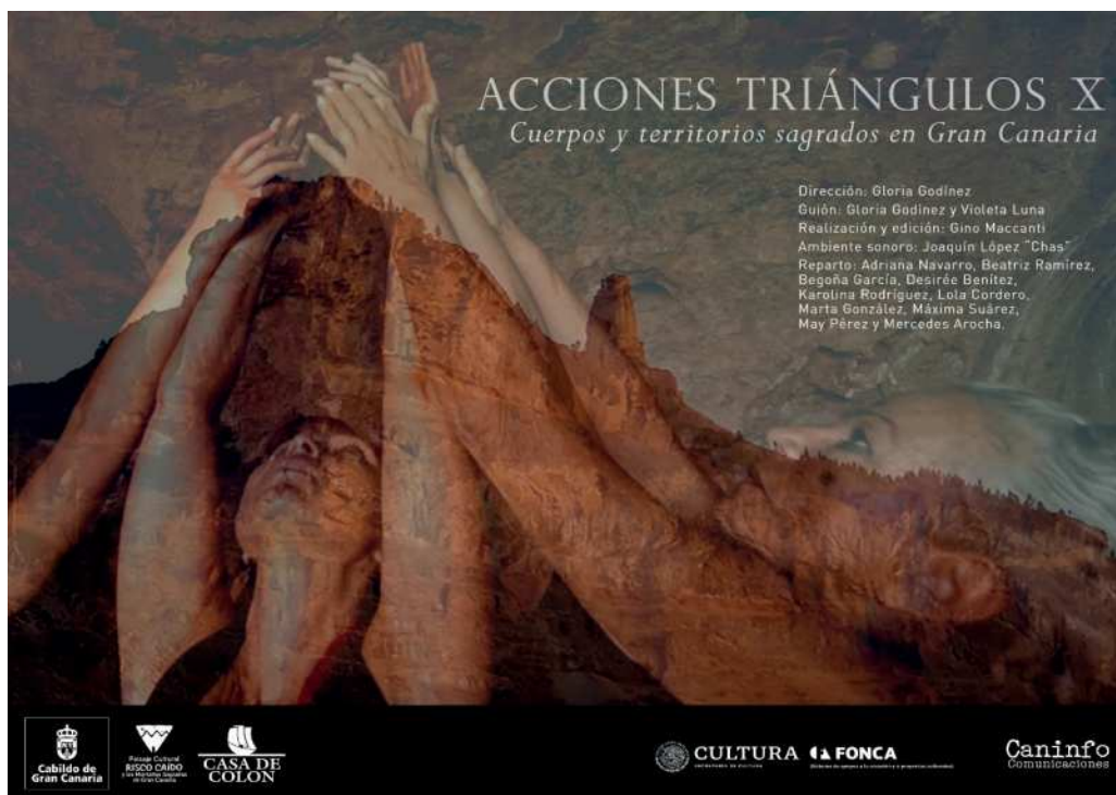
Fig. 1. Cartel de Acciones Triángulos X. Cuerpos y territorios sagrados en Gran Canaria.

En esta ponencia titulada «Acciones Art-queológicas de mujeres en el paisaje cultural de Risco Caído y las montañas sagradas de Gran Canaria» agrego el prefijo «art» para indicar que el pensamiento arqueológico al cual me refiero no es sólo el de los y las profesionales de esa ciencia sino a aquel pensamiento que está presente en todas las personas que se detienen conscientemente a imaginar, cuestionar y reelaborar su propio origen.