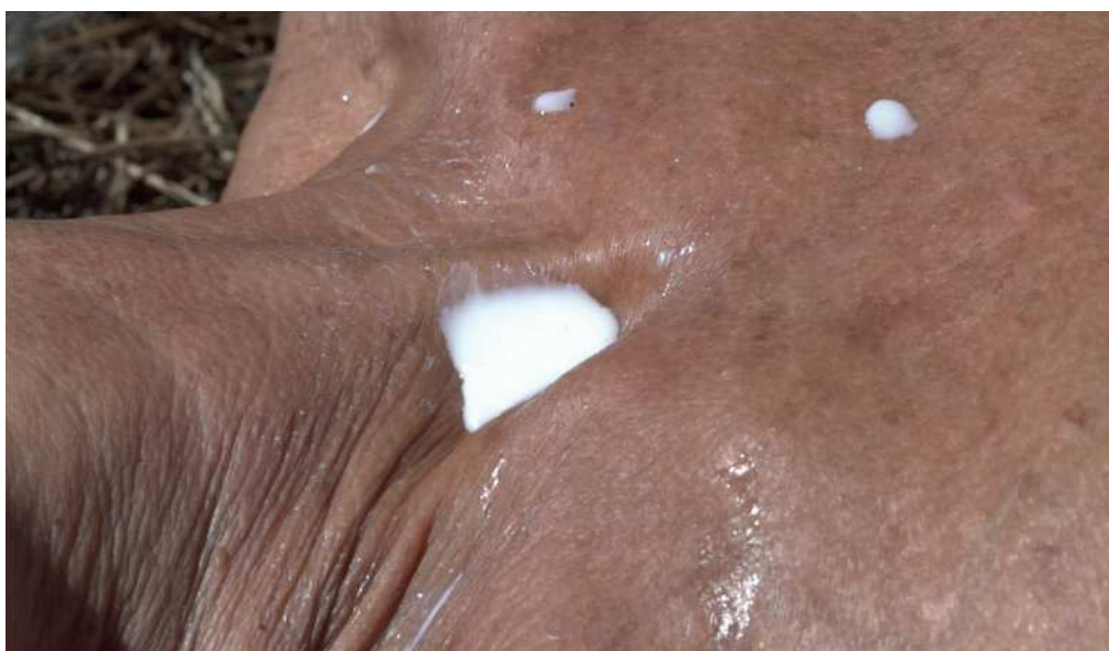
Fig. 6. Acciones Triángulos X. Cuerpos y territorios sagrados en Gran Canaria, Fuente: Fotograma, 2020.

En las imágenes que se recogen en vídeo pueden verse acciones reales de las mujeres que revisaron y cuestionaron sus imaginarios trogloditas a partir de ciertos objetos como vasijas, silbos, caracolas, lapas, piedras, y, sobre todo los grabados rupestres. Los triángulos púbicos que se encuentran grabados en el interior de las cuevas funcionan como marcas de intensidad ancestral, cuya figura triangular posee valor y vínculo sagrado con el cuerpo y el territorio, con el cosmos y la naturaleza. Este video recoge «imágenes que nunca vimos antes de recordarlas» 6 . Con esta frase se explica lo que el filósofo Walter Benjamin nos convoca a realizar desde el arte y el pensamiento histórico -y arqueológico-, esto es, encontrar en nuestros recuerdos como humanidad algo que prefigure el porvenir, no para conmemorar objetos sepultados bajo tierra sino para movilizar memorias y emprender el vuelo hacia un horizonte más justo y equilibrado.