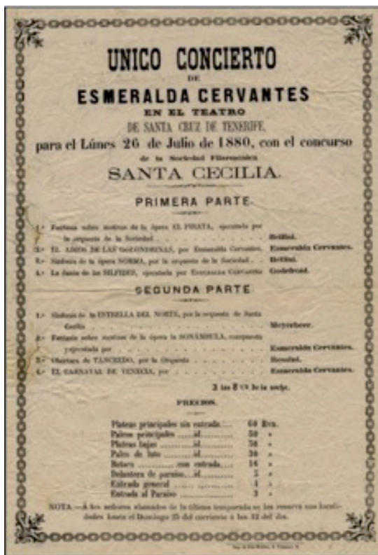
Programa de Concierto de E. Cervantes (26-VII-1880). Gaviño de Franchy en http://lopedeclavijo.blogspot.com

Visitó por primera vez el Archipiélago Canario en 1880 llegando a Tenerife el 13 de julio y el 1 de agosto a Las Palmas, estableciéndose definitivamente en Tenerife, unos años después.