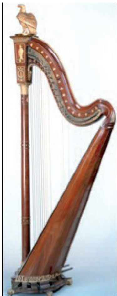
Arpa de la Emperatriz Josefina Bonaparte fabricada por Cousineau Padre e Hijo en París (c. 1805) BARTHEL (2005), p. 75