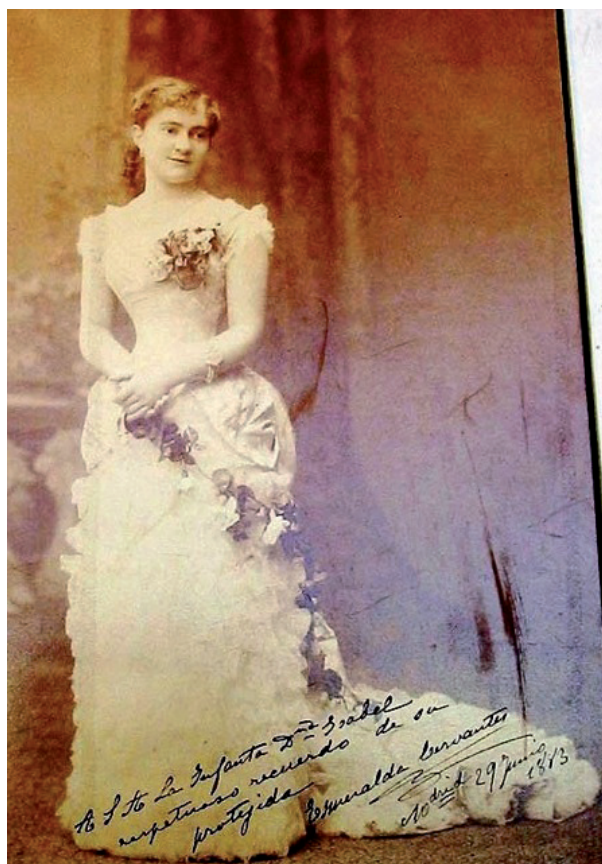
E. Cervantes Biblioteca Nacional (Madrid)

meralda Cervantes. Residió concretamente en Tenerife, lugar donde reposan sus restos desde 1926, aunque tal situación no la privó de constantes idas i venidas a través de giras triunfales de conciertos e intentos de perpetuar su arte a través de la docencia, por el continente americano.