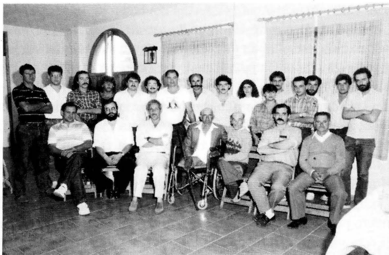
La A.J.U.P.A.L. Miembros fundadores