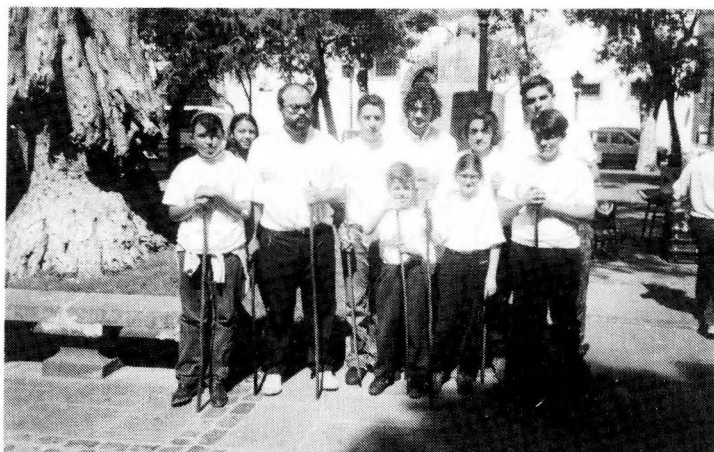
Escuela municipal de Palo Canario de La Laguna. Monitores y alumnos

En noviembre, fruto del acuerdo entre el Patronato de Deportes de La Laguna y el C.U.P.C. y dentro del "Plan de Promoción Deportiva" del Cabildo de Tenerife, comienza a funcionar la Escuela de Palo Canario del Colegio Público de Las Mercedes , primera de las varias creadas en años posteriores (hasta cuatro simultáneas) en otros Colegios Públicos de La Laguna. Por problemas presupuestarios no se crearon más. Actualmente siguen en funcionamiento englobadas dentro de la denominación Escuelas Municipales de Palo Canario de La Laguna .