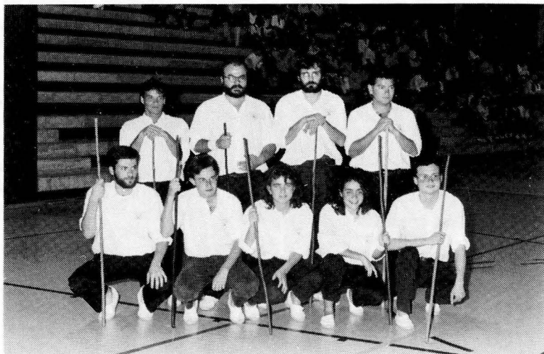
El C.U.P.C.: Integrantes de uno de sus grupos de exhibición

curso académico. Son estos primeros cursos, los del cambio de metodología desde una enseñanza tradicional familiar , de núcleos reducidos, a una enseñanza más metódica, a grupos más numerosos. No fue fácil.