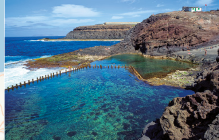
Piscinas naturales de Roque Prieto.