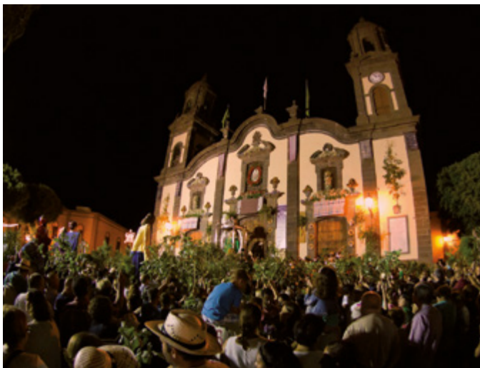
Llegada Rama Las Marías.

Tiene lugar en dos ediciones, el último fin de semana de abril en el Casco Histórico y el primer fin de semana de mayo en el pago de Montaña Alta. En ella los queseros y otros artesanos ofrecen sus mejores productos, se ofrecen degustaciones de comidas típicas y se organizan demostraciones de actividades tradicionales relacionadas con la ganadería y el pastoreo.