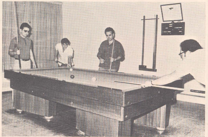
MESA DE LOS JUECES

También se dio cuenta del estado de ingresos y gastos, correspondiente al trimestre primero de 1.970