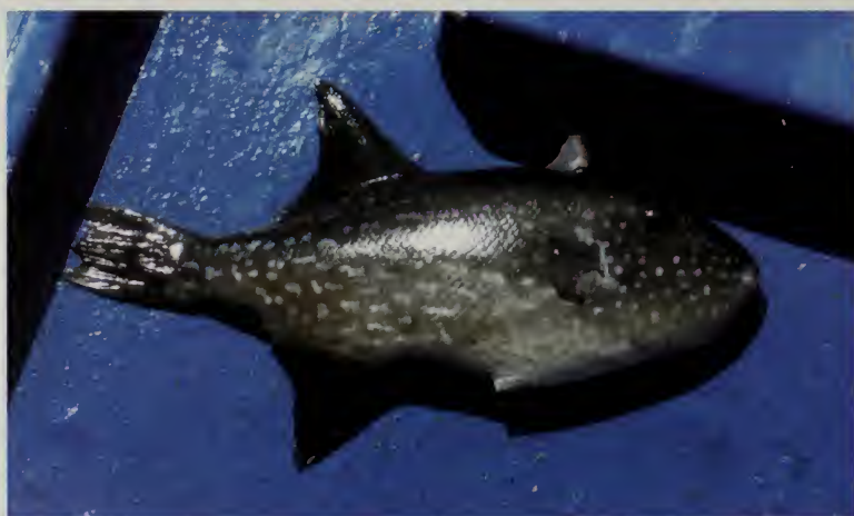
Figura 1. Diodon holocanthus (arriba y centro) y Canthidermis maculata (abajo).