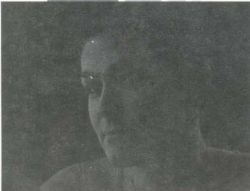
Fotogramas de Mirar es un pecado , de Nicolás Mellini