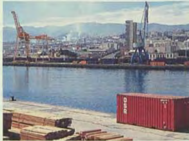
Puerto de Santa Cruz de Tenerife.