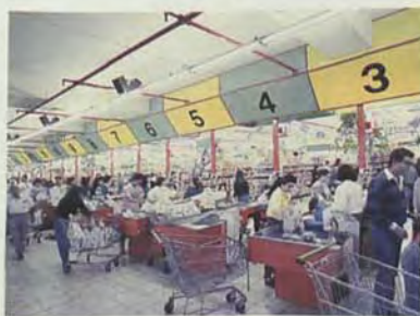
Establecimientos de alimentación