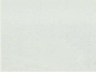
Plano del terreno en la zona de la zona de la zona