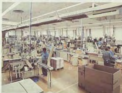
Industria tabaquera en El Paso. La Palma.

La industria es el sector de la economía que se dedica a transformar materias primas en productos acabados. Este sector es fundamental para el desarrollo económico de un país, ya que genera empleo y contribuye al PIB. En este capítulo se analizan los principales sectores industriales y su impacto en el medio ambiente y la sociedad.