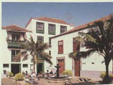
Arquitectura típica. Santa Cruz de la Palma.