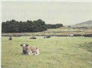
Centro de explotación ganadera en la isla de El Hierro.