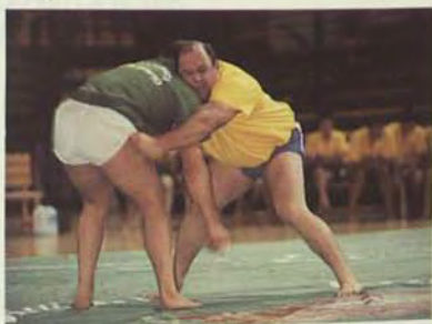
Lucha Canaria en Tenerife.