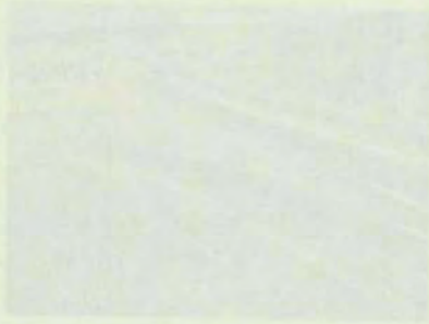
Edificio de la Facultad de Ciencias