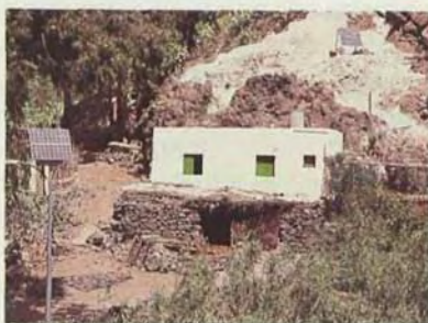
Instalaciones de energía solar en Guayadeque. Gran Canaria.