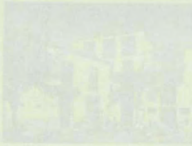
Edificio de la Facultad de Ciencias