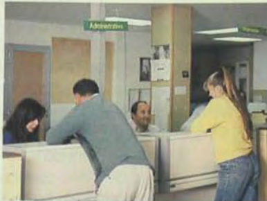
Oficinas del Instituto Nacional de Empleo.