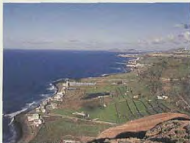
Cultivo del platano en la costa de Bañaderos. Gran Canaria.