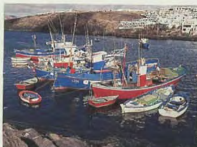
Pesca artesanal en Puerto del Carmen. Lanzarote.