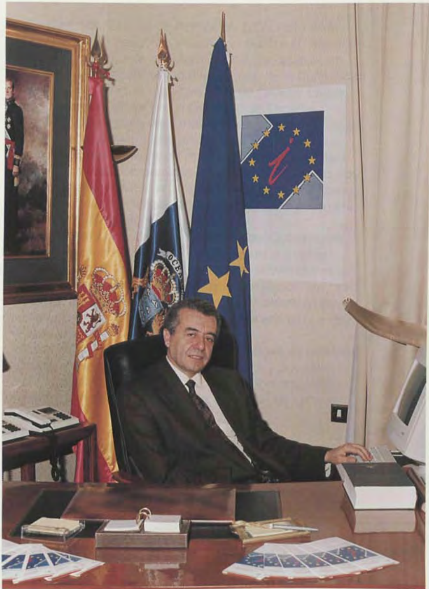
INAUGURACION EN CANARIAS DEL CENTRO EUROPEO DE INFORMACION EMPRESARIAL POR EL EXCMO. SR. D. LORENZO OLARTE CULLEN, EL DIA 28 DE MARZO DE 1990