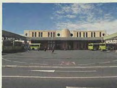
Estación de guaguas de la Laguna. Tenerife.