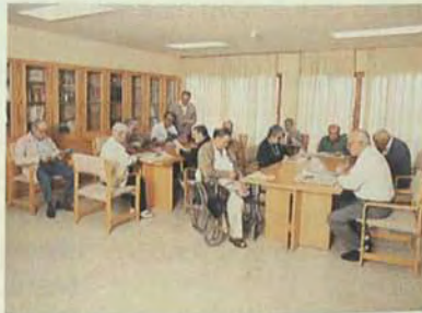
Residencia para la tercera edad. Taliarte. Gran Canaria.