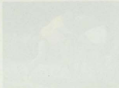
Figura 2. [Illegible text]