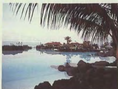
Lago Martinez. Puerto de la Cruz. Tenerife.