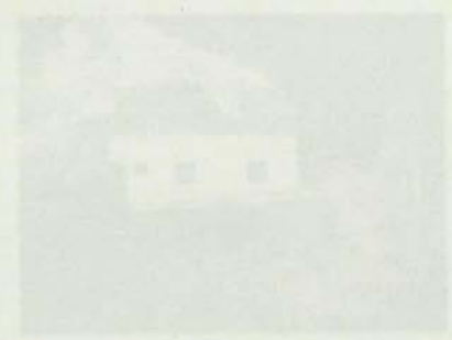
El edificio de la Universidad de Chile, sede de la Facultad de Ciencias Físicas y Matemáticas.