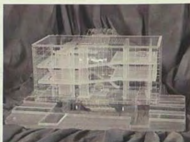
Maqueta del Pabellón de Canarias para la Expo '92