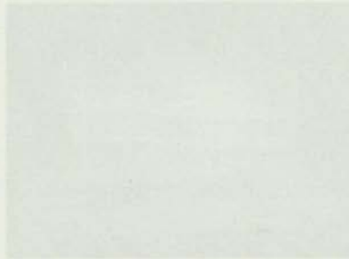
Figura 1. [Illegible text]