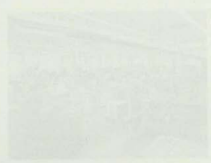
El edificio de la Universidad de Chile, sede de la Facultad de Ciencias Físicas y Matemáticas.