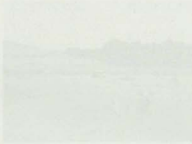
Plano del terreno en la zona de la zona de la zona