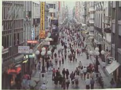
Zona comercial de Triana en Las Palmas de Gran Canaria.