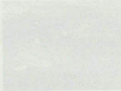
Plano del terreno en la zona de la zona de la zona