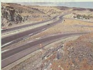
Autopista GC-1. Gran Canaria.