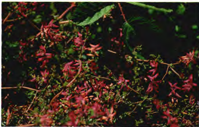
PAMPINA MORINILLA FUMARIA OFFICINALIS L.