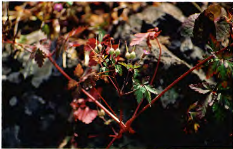
GERANIO DE SAN ROBERTO ( ALFILERILLO ) GERANIUM ROBERTIANUM