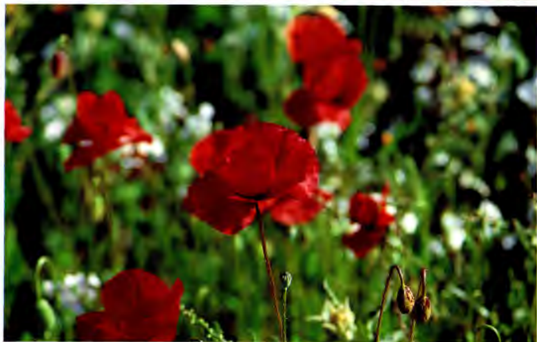
AMAPOLA ( MAJAPOLA ) PAPAVER RHOEAS L.