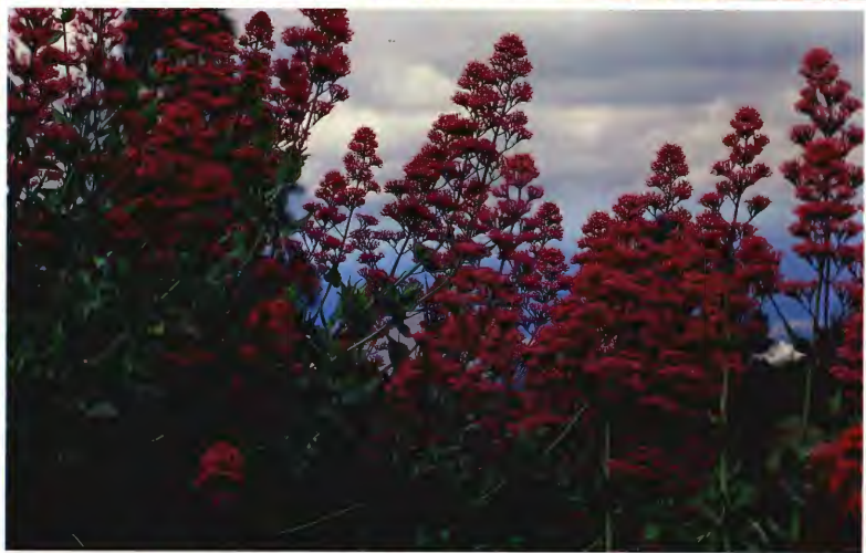
VALERIANA ( VALERIANA MANSA O MILAMORES ) CENTRANTHUS RUBER D. C.