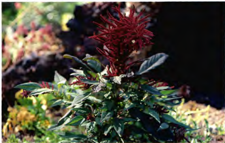
MOCO DE PAVO AMARANTHUS CAUDATUS L.