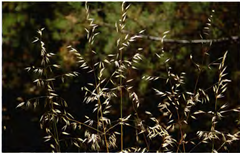
AVENA SALVAJE (CHIROTE) AVENA CANARIENSIS BAUM.