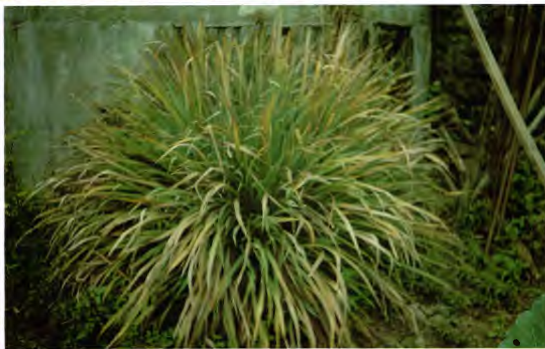
CAÑA LIMÓN ( CAÑA DE LIMÓN ) CYMBOPOYON CITRATUS DC.