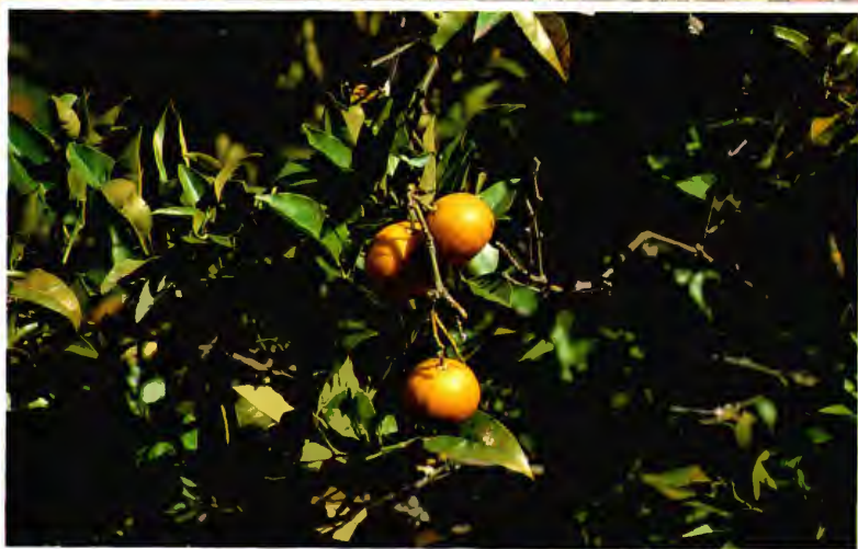
NARANJO AMARGO CITRUS AURANTIUM L.