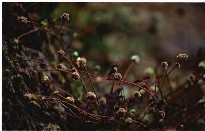
ALGAFITA SANGUISORBA MINOR SOAP.