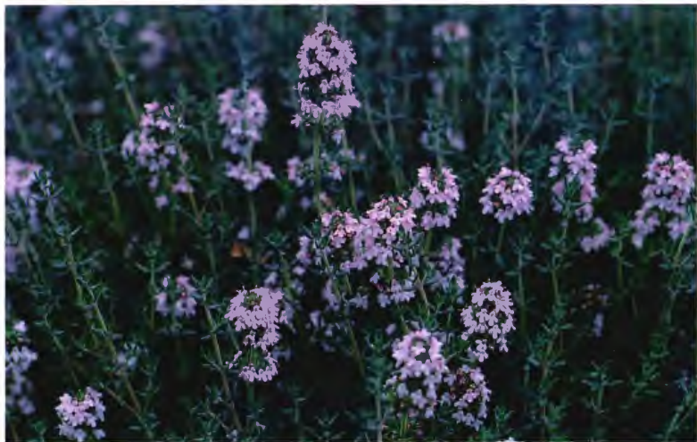
TOMILLO THYMUS VULGARIS L.