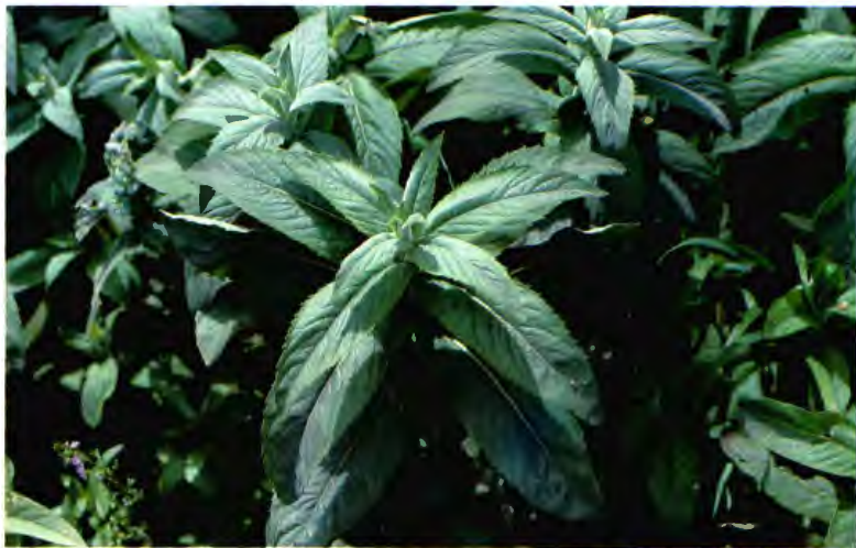
MASTRANTO (MASTRANZO) MENTHA SUAVEOLENS EHRT.