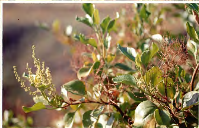
VINAGRERA (CALCOSA) RUMEX LUNARIA L.