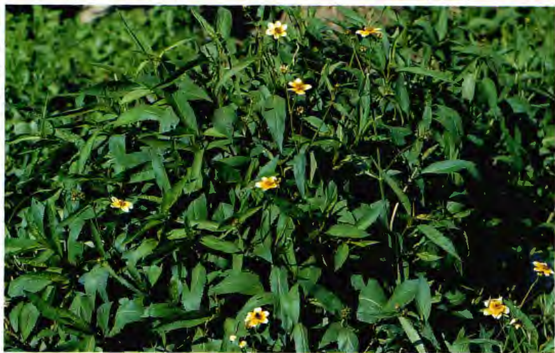
TE CANARIO (TE SALVAJE) BIDENS AUREA DRYAND SVERFF