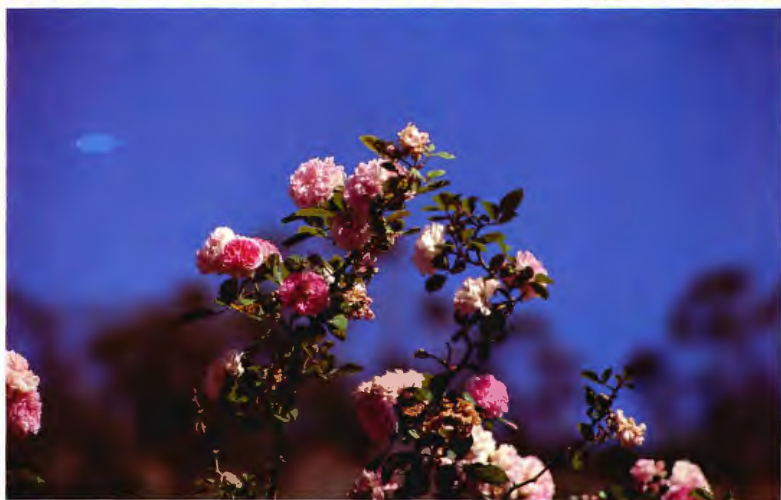
ROSA ( ROSA SILVESTRE ) ROSA MULTIFLORA AP.