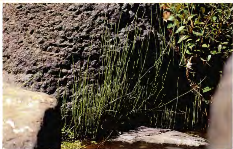
COLA DE CABALLO EQUISETUM RAMOSISSIMUM DESF.