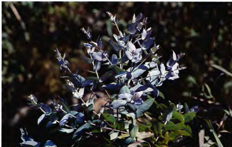
EUCALIPTO BLANCO EUCALYPTUS GLOBULUS LABILL.