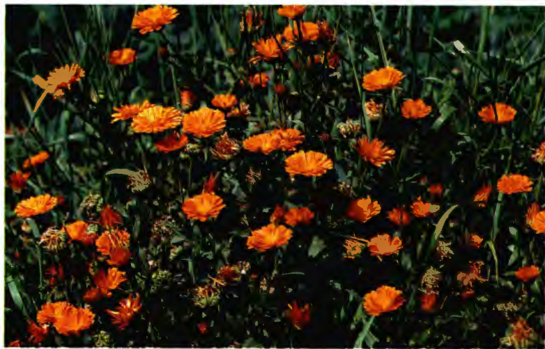
CALENDULA (ALPODADERA O MARAVILLA) CALENDULA OFFICINALIS L.