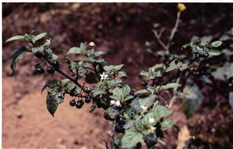
HIERBA MORA ( HIERBA SANTA MARIA ) SOLANUM NIGRUM L.