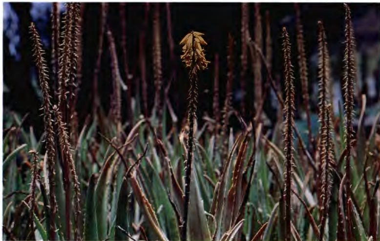
PITA ZABILA ALOE VERA L. BURM.