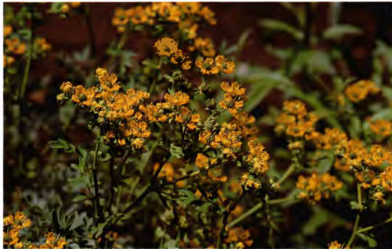
RUDA RUTA GRAVEOLENS L.