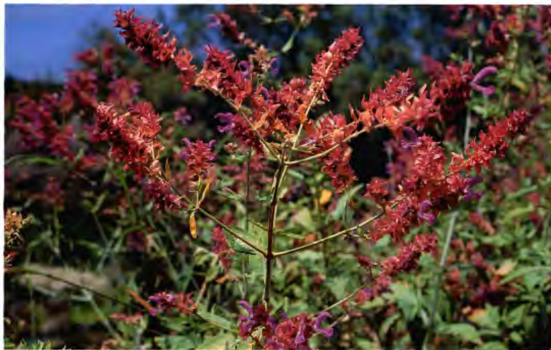
SALVIA MORISCA SALVIA CANARIENSIS L.