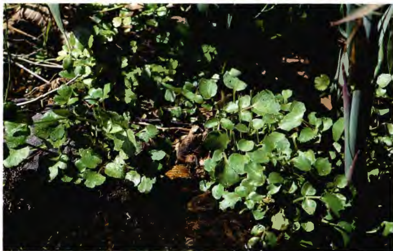
BERRO NASTURTIIUM OFFICINALIS R. BR.