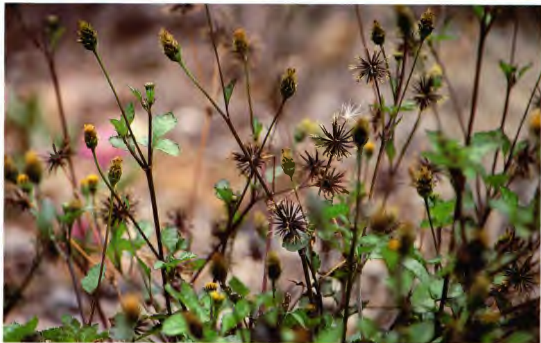
BRUJILLA ( AMOR SECO ) BIDENS PILOSA L.