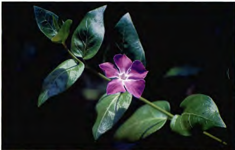
VINCA ( HIERBA DONCELLA ) VINCA MAJOR L.