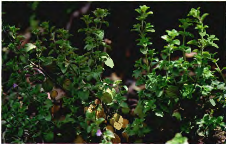
NAUTA ( YERBA MUJER ) CALAMINTHA SYLVATICA BROME