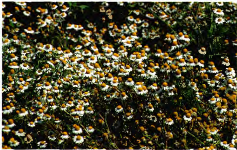
MANZANILLA CHAMOMILLA RECUTITA RAUSCH