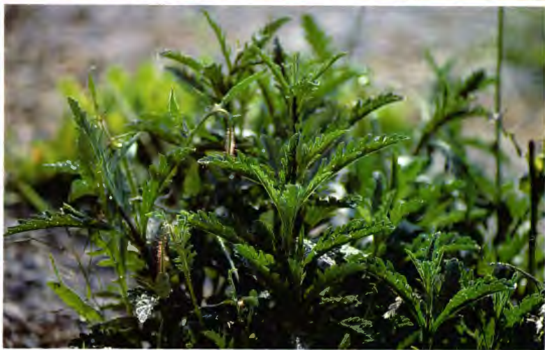
TREINTA NUDOS POLYGONUM AVICULARE L.