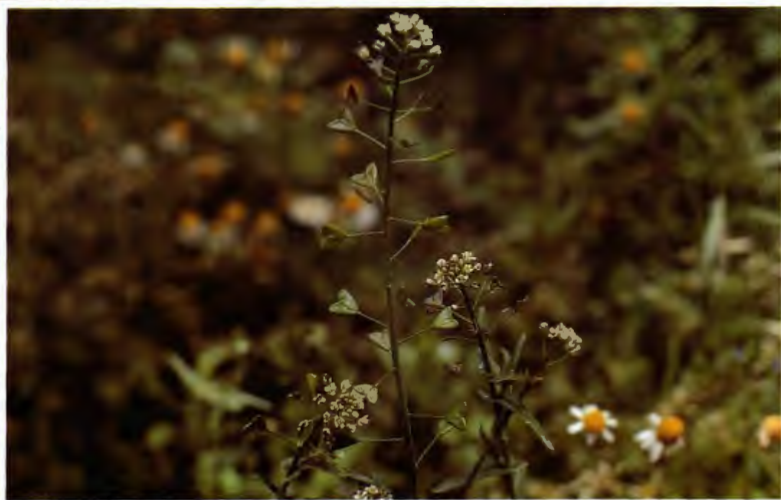
BOLSA DE PASTOR ( PAN Y QUESILLO ) CAPSELLA BURSA-PASTORIS L.