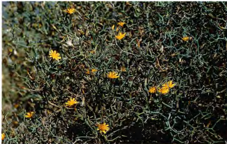
AULAGA ( JULAGA ) LAUNAEA ARBORESCENS BATT.