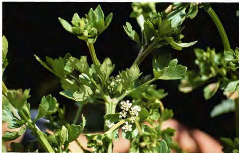
APIO APIUM GRAVEOLENS L.