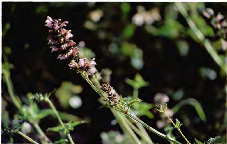
NIOTA ( ALGARITOFE ) CEDRONELLA CANARIENSIS WEBB. Y BERTH.