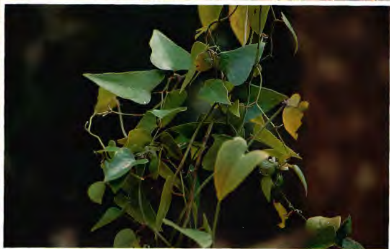
ZARZAPARRILLA ( CERRAJUDA ) SMILAX ASPERA L.