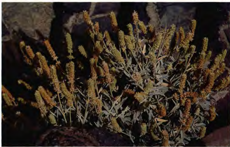
SALVIA BLANCA SIDERITIS DASYGNAPHALA (W. Y B.) CROST.