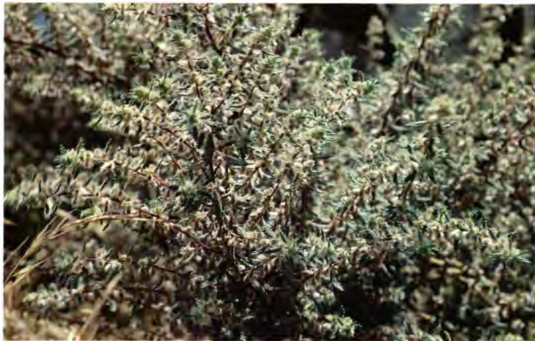
RATONERA FORSSKAOLEA ANGUSTIFOLIA RETZ.