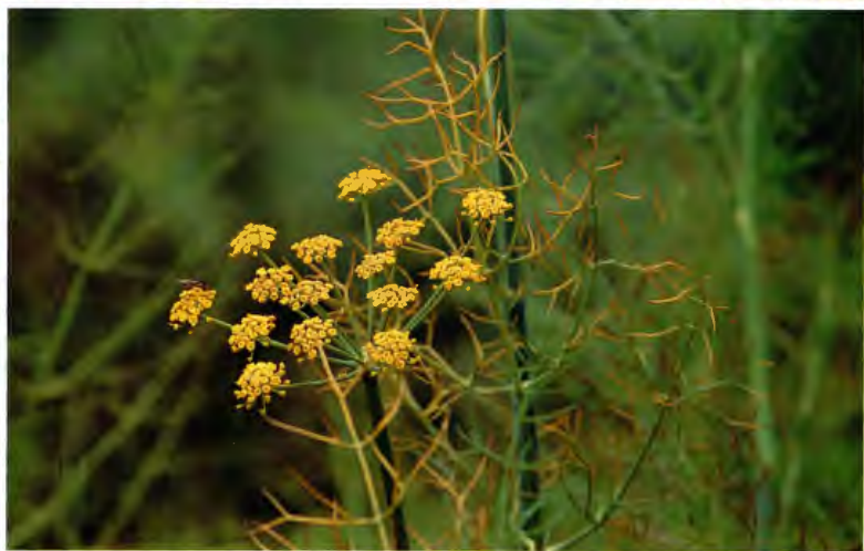
HINOJO ( MATALAHUGA O MATALAUVA ) FOENICULUM VULGARE MILLER