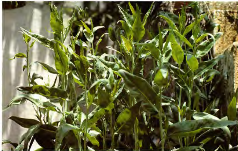
ROMPEPIEDRAS LEPIDIUM LATIFOLIUM L.