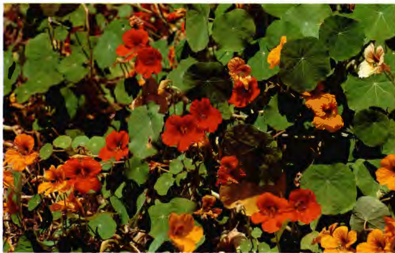
CAPUCHINA TROPAEOLUM MAJUS L.