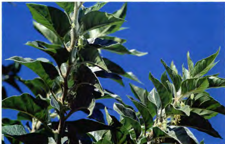
OROVAL WITHARIA ARISTATA AIT.