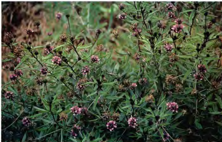
VERBENA VERBENA OFFICINALIS L.