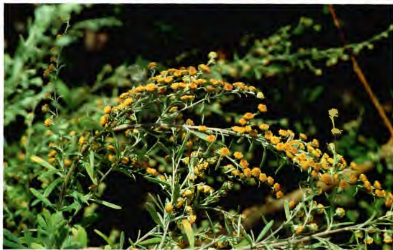
INCIENSO CANARIO ARTEMISA CANARIENSIS LESS