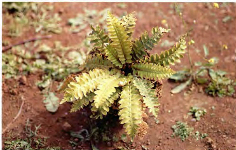
DORADILLA CETERACH AUREUM BUCH