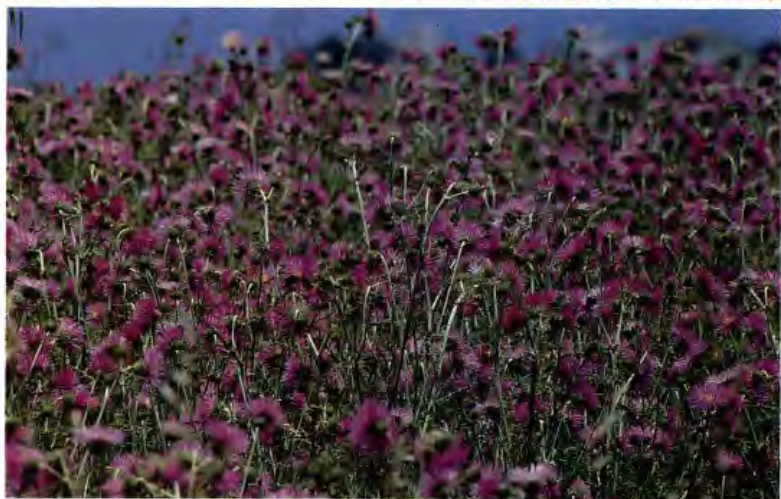
CARDO BORRIQUERO CARDUUS SP.