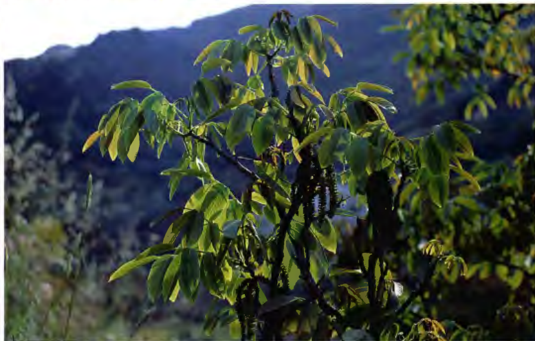
NOGAL JUGLANS REGIA L.