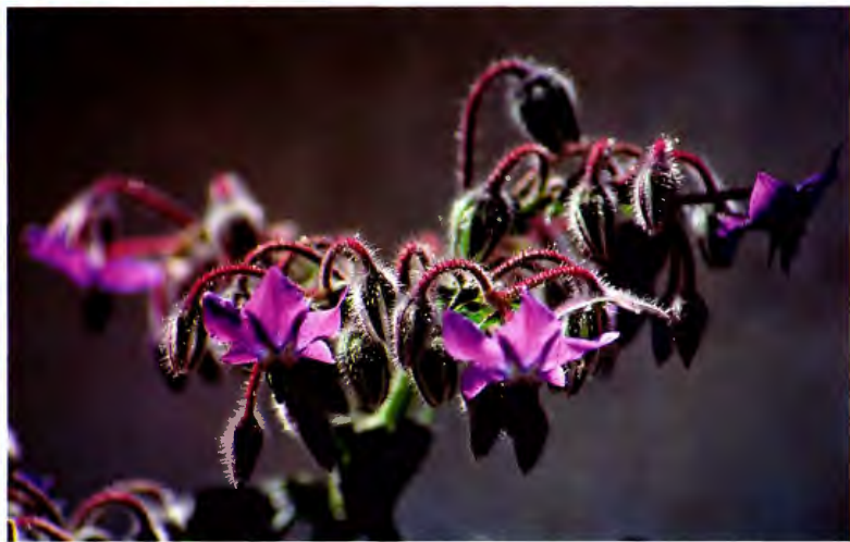
BORRAJA BORAGO OFFICINALIS L.