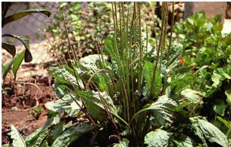
LLANTEN ( LANTEN ) PLANTAGO MAJOR L.