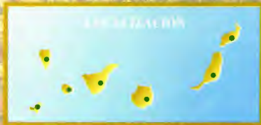
Ilustración: C. de la Fuente & C. de la Fuente Mapa: C. de la Fuente & C. de la Fuente Diseño: C. de la Fuente & C. de la Fuente Impresión: C. de la Fuente & C. de la Fuente