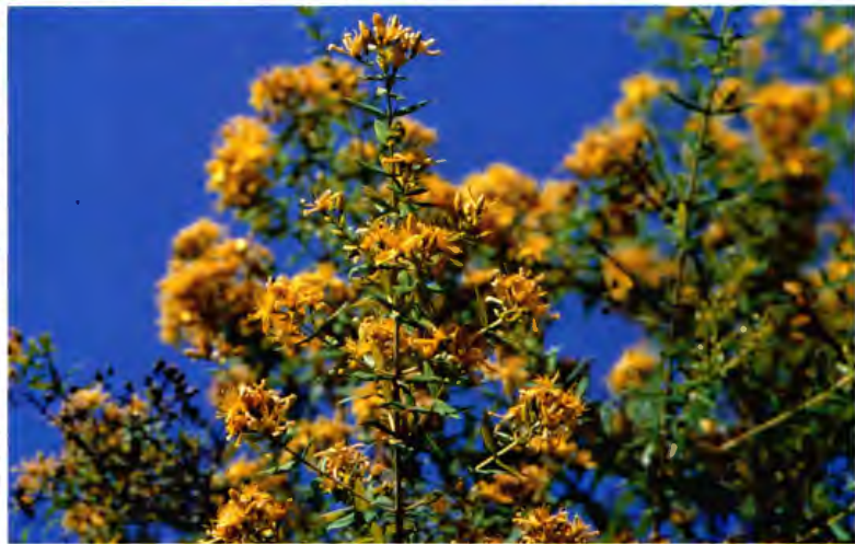
HIPERICO (GRANADILLO O FLOR DE CRUZ) HYPERICUM CANARIENSE L.