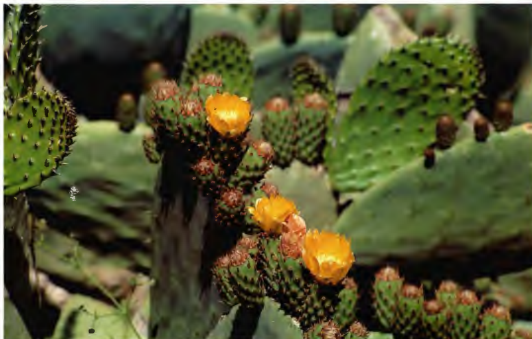
TUNERA OPUNTIA FICUS-BARBARICA A. BERGER