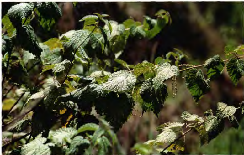
ORTIGON URTICA MORIFOLIA POIR.