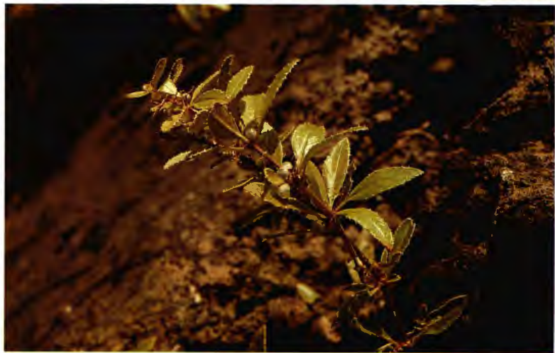
TASAIGO (TASALLO) RUBIA FRUCTICOSA AIT.