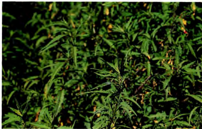
PAZOTE CHENOPODIUM AMBROSIOIDES L.