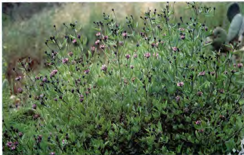
TEDERA (TEERA) PSORALEA BITUMINOSA L.