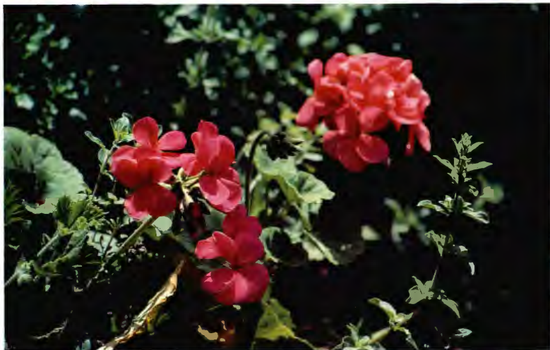
GERANIO PELARGONIUM S. P. HYBRIDUM