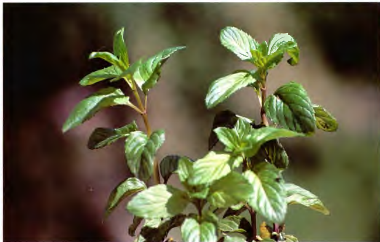
SANDARA (SANDALO) MENTHA AQUATICA L.