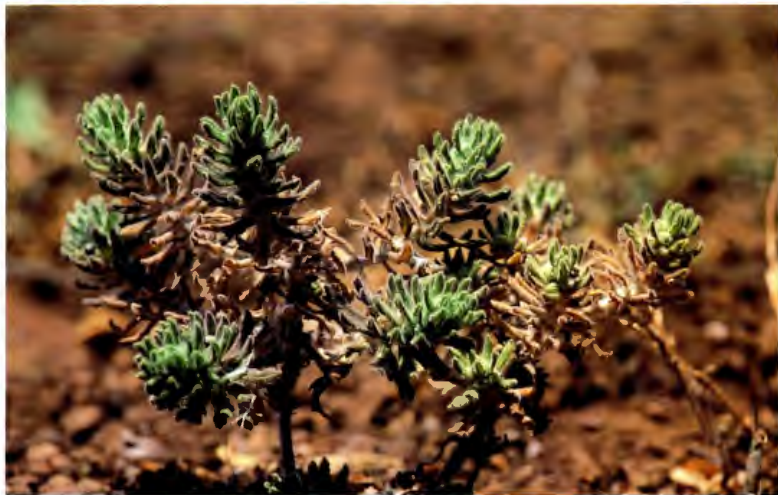
HIERBA CLIN ( HIERBA CRIN ) AJUGA IVA L.