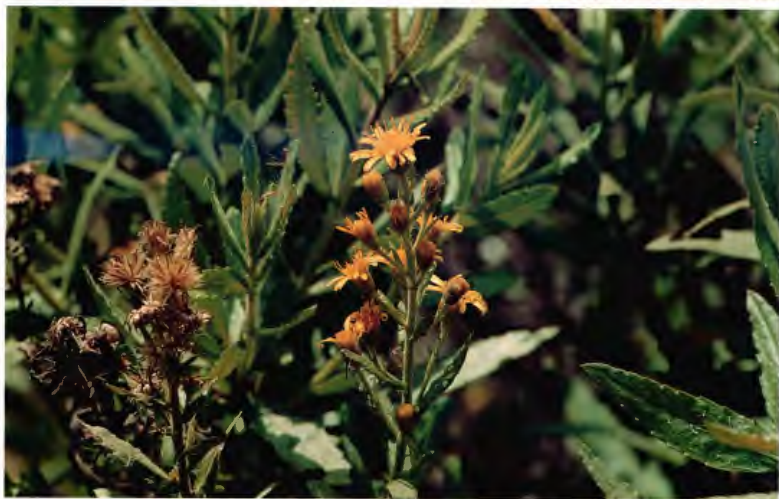
ALTABACA DITTRICHIA VISCOSA L. GREUTER