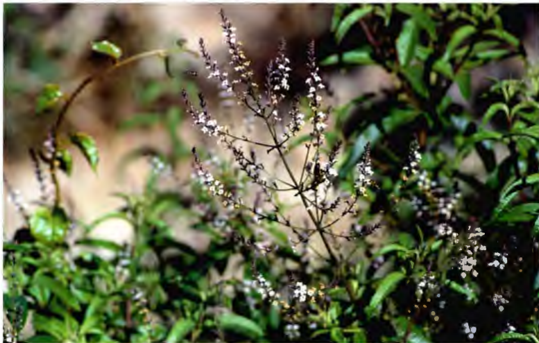
HIERBA LUISA LIPPIA CITRIODORA, LIPPIA TRIPHYLLA L'HER