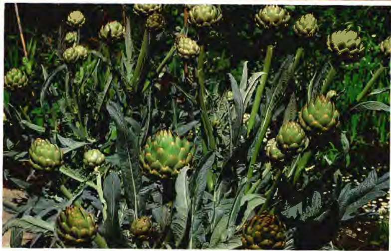
ALCACHOFA CYNARA SCOLYMUS L.