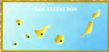
Ilustración: J. García Diseño: J. García