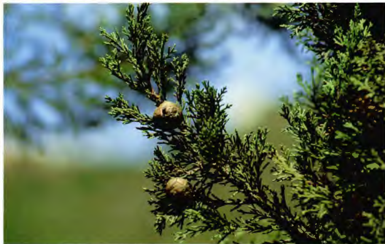
CIPRES CUPRESSUS SEMPERVIRENS L.