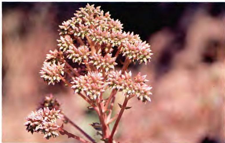
VEROL AEONIUM SP.