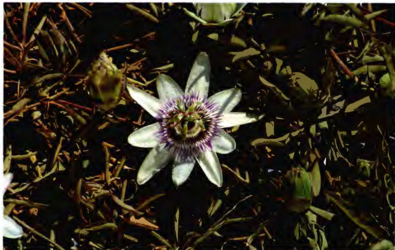
PASIONARIA ( FLOR DE LA PASION, FLOR DE PARCHITA O MARACUYA ) PASIFLORA INCARNATA L.