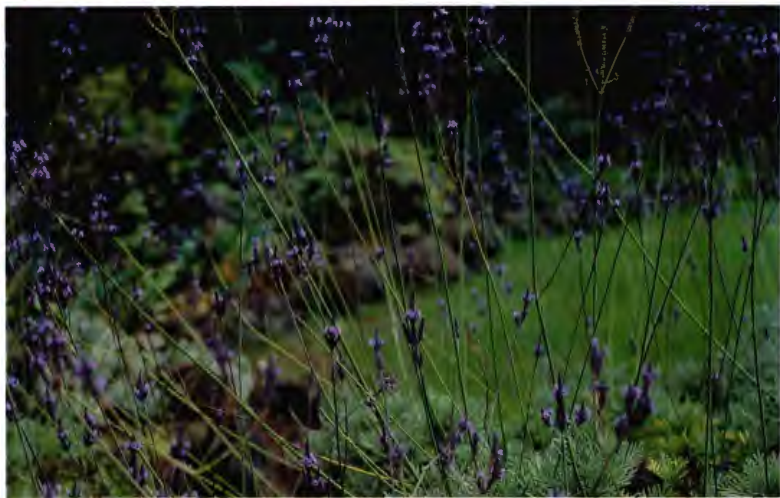
LAVANDA LAVANDULA CANARIENSIS MILL.