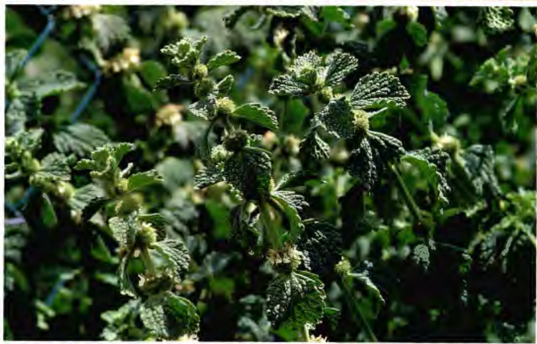
MARRUBIO BLANCO MARRUBIUM VULGARE L.