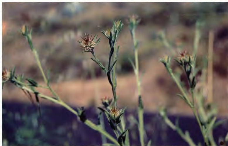
ABREPUÑO CENTAUREA MELITENSIS L.