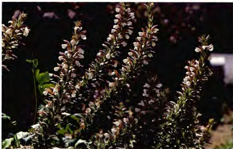
ACANTO ( ACANTA ) ACANTHUS MOLLIS L.