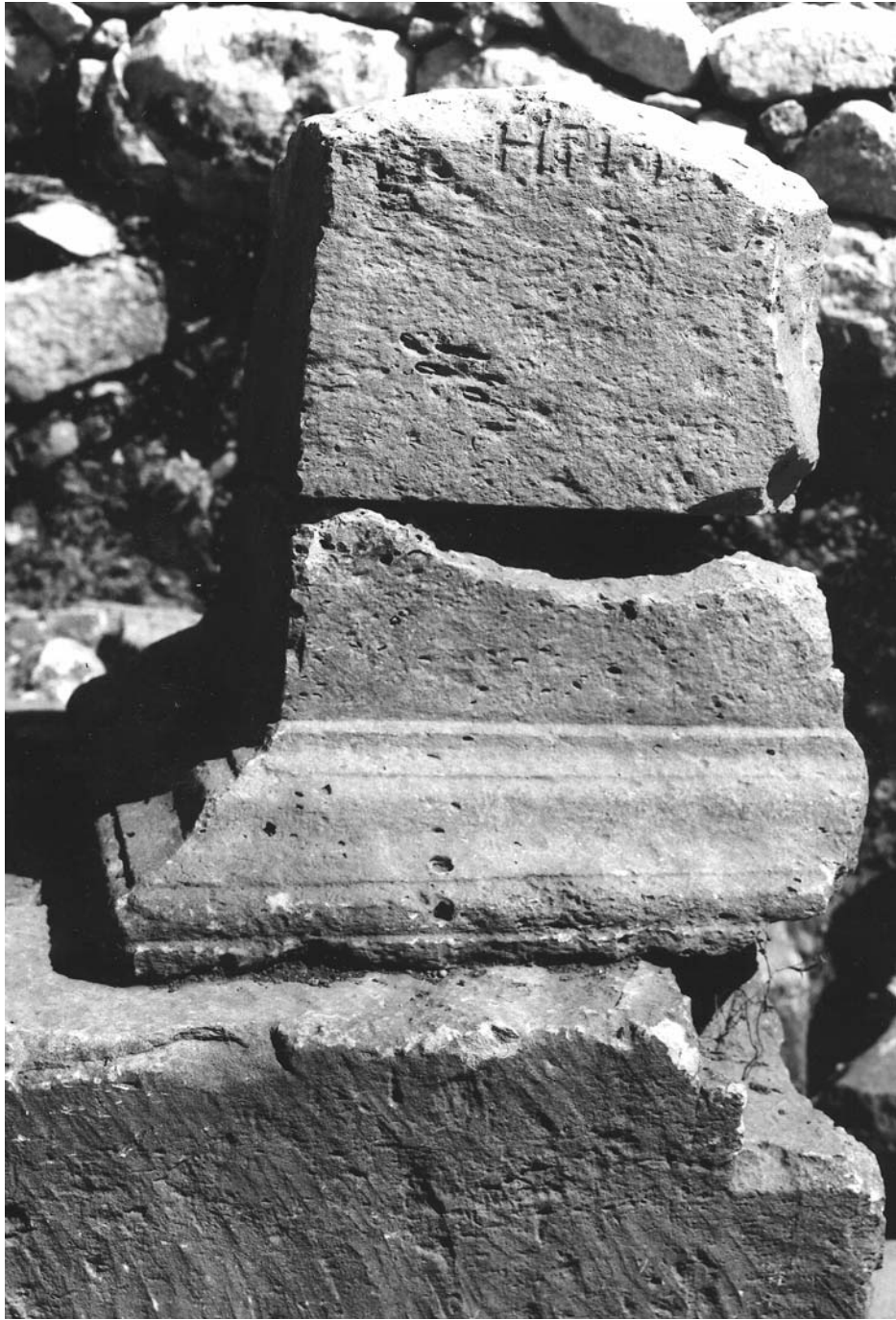
Figura 4: Inscripción 3.