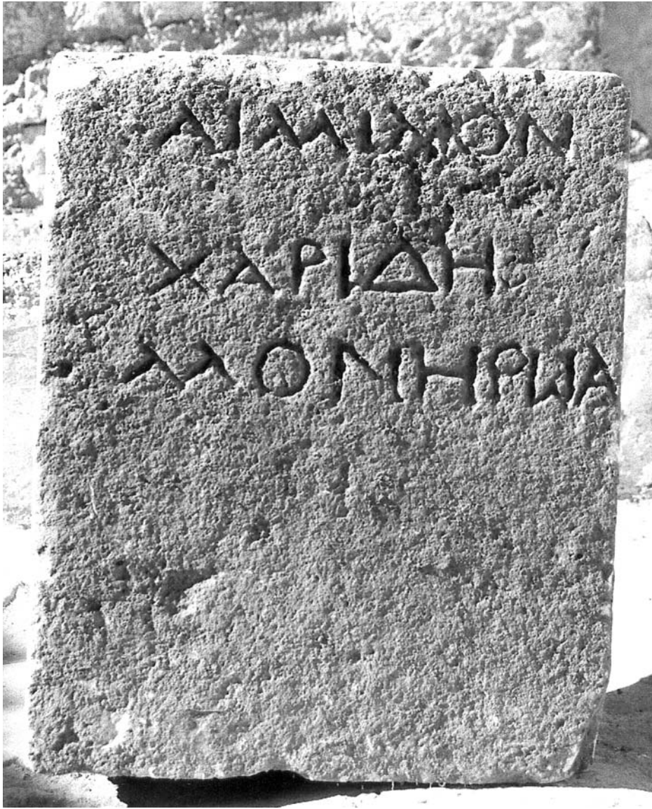
Figura 6: Inscripción 5.