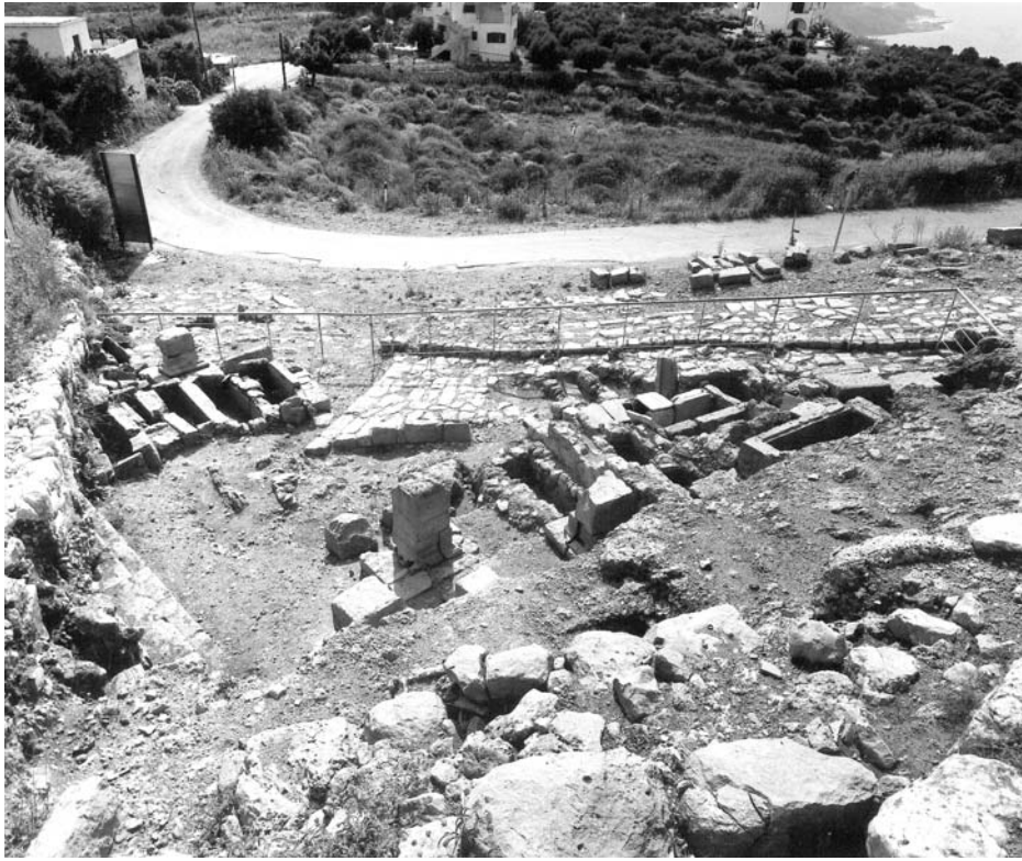
Figura 1: Vista general del yacimiento arqueológico.