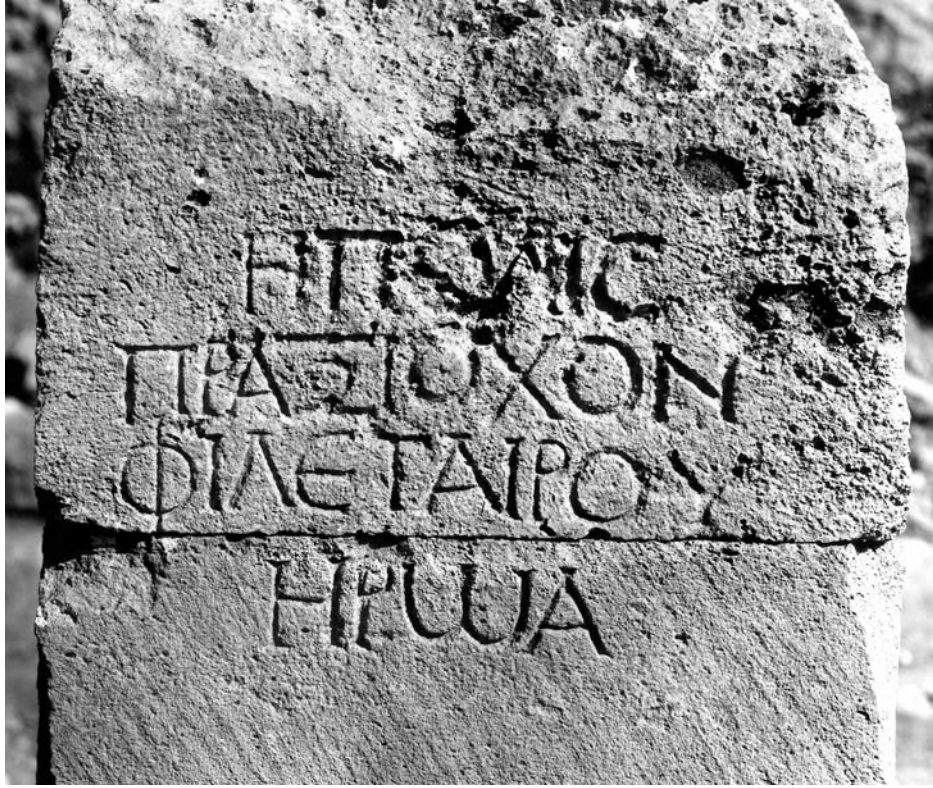
Figura 2B: Inscripción 1. Detalle.