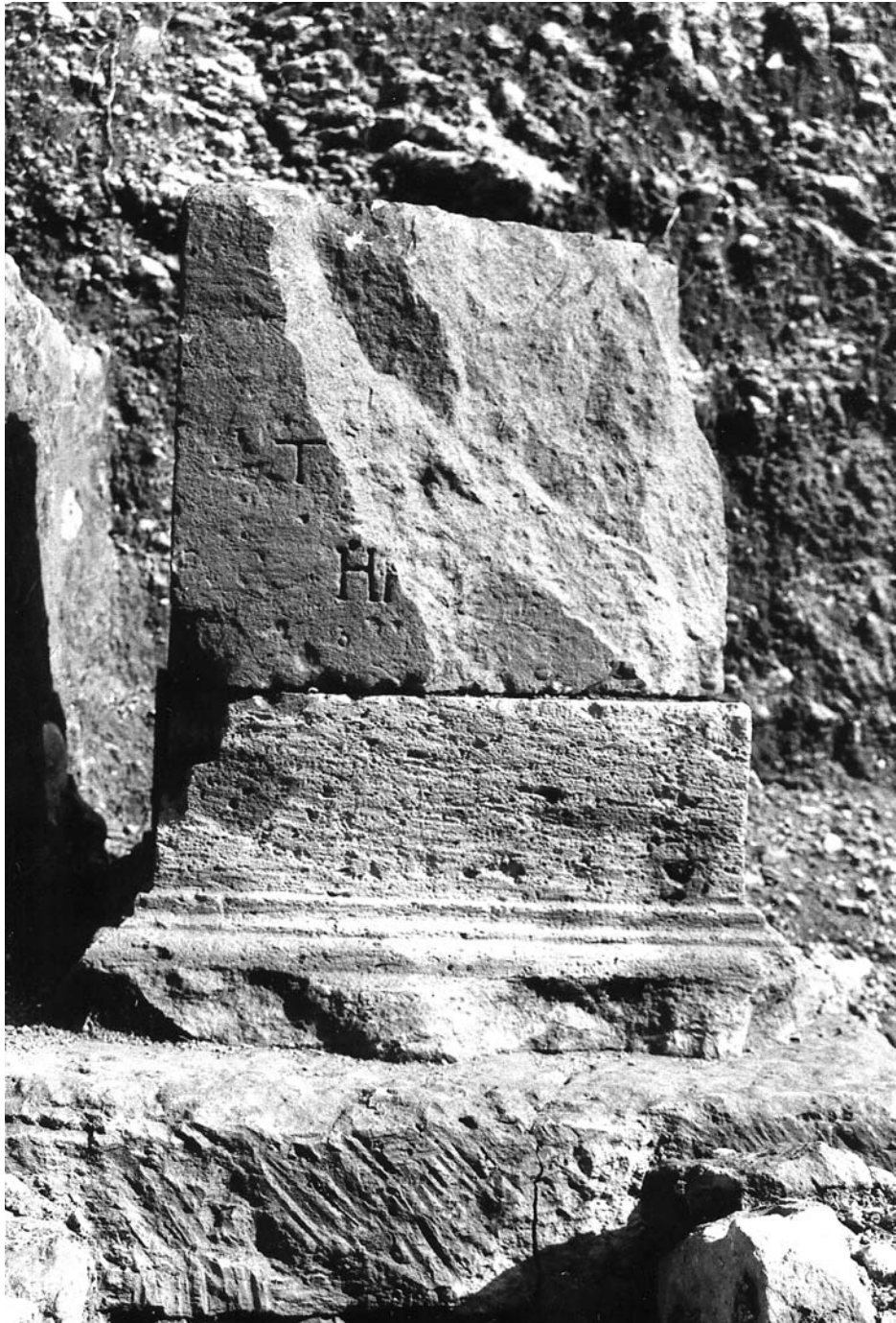
Figura 3: Inscripción 2.