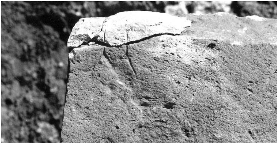
Figura 5B: Inscripción 4. Detalle.