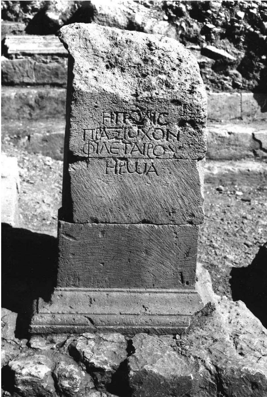
Figura 2A: Inscripción 1.