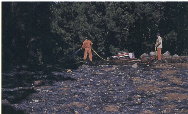
Las labores de extinción de incendios forestales requieren profesionalidad, experiencia y destreza.

Los incendios, muy a pesar nuestro, siempre estarán presentes, es algo propio de la naturaleza, pero por eso mismo ha de ser natural, nunca intencionado o debido a negligencia humana, estos últimos son los peores.