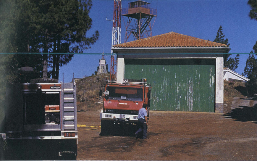
Junto con la actuación del hombre, los operativos de incendio (cubas, emisoras, etc.) son fundamentales para enfrentar con éxito un fuego.

deberá intentar su extinción con la máxima urgencia, si lo permite la distancia del fuego y su intensidad. En caso contrario, deberá avisar del hecho por el medio más rápido posible a cualquiera de los siguientes puntos: