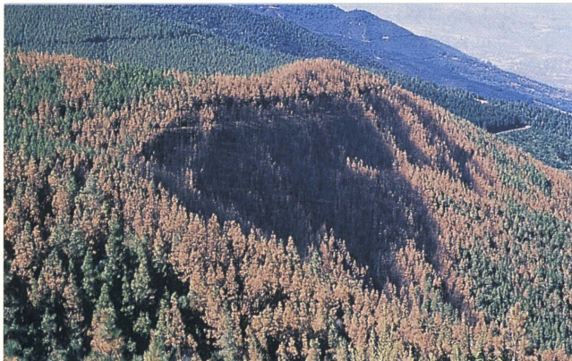
Tras el incendio quedan sus huellas, el suelo quemado y el pinar ennegrecido. Su proverbial resistencia al fuego y el tiempo restañarán las heridas.