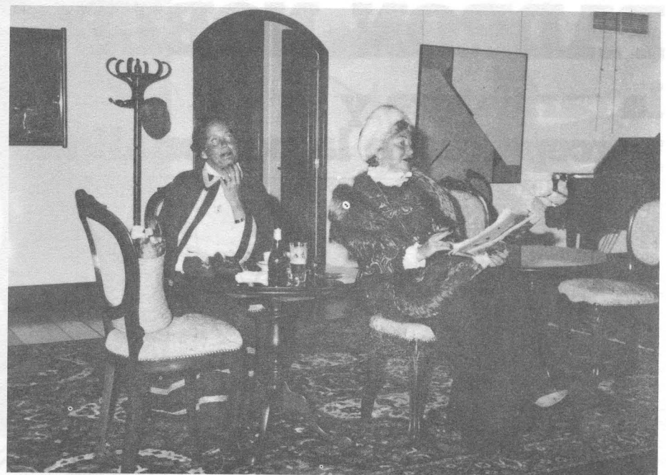
Actuación del grupo de teatro "Pérez Galdós" en el Aula Cultural

La más fuerte , (Grupo Pérez Galdós); El bello indiferente (Grupo Pérez Galdós); Un duelo como todos pero distinto a los demás (Profetas de Mueble Bar); Amor de D. Perlimplin con Belisa en su jardín (Grupo Muñoz Seca); Sangre gorda ,