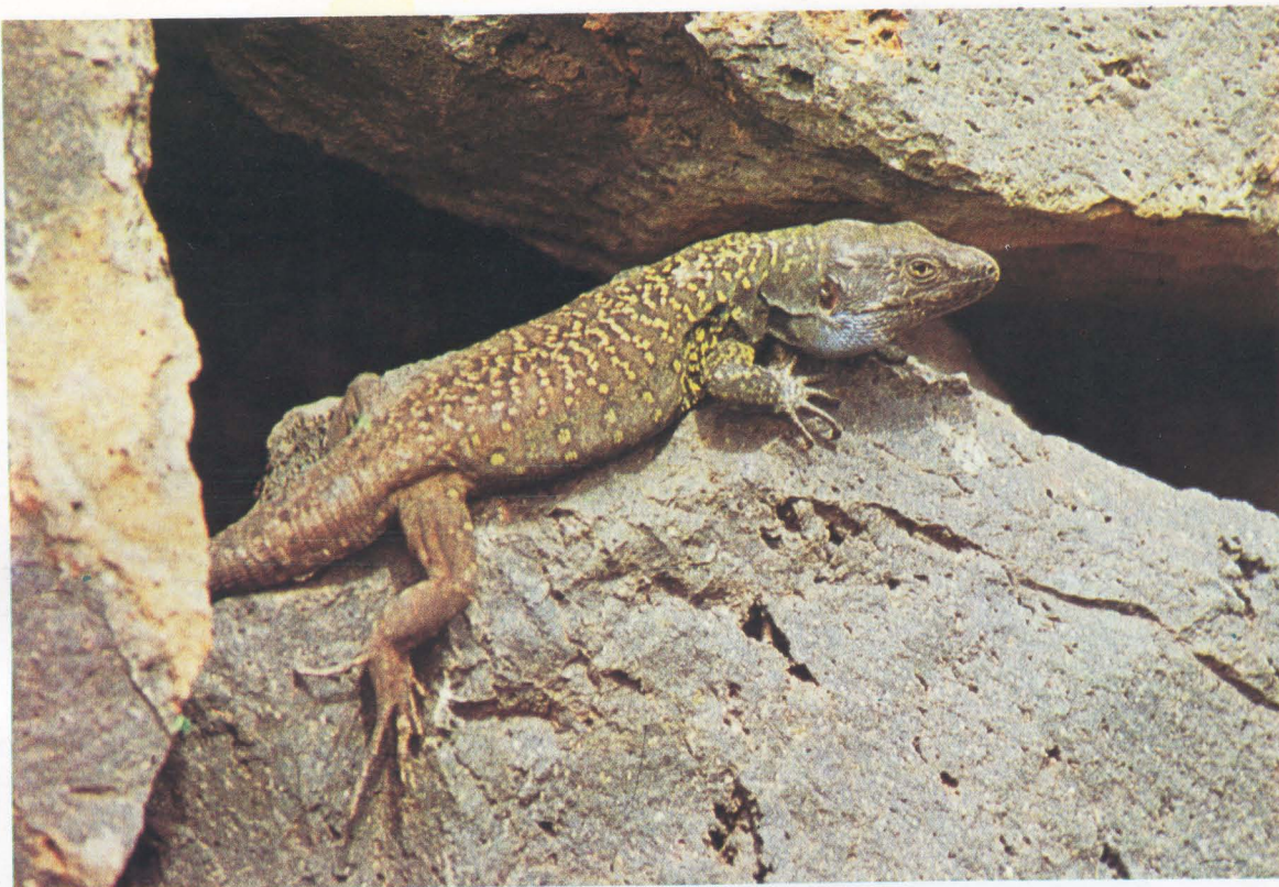
LAGARTO MACHO DEL NORTE