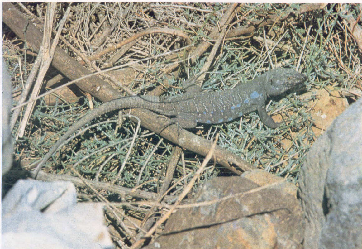
LAGARTO MACHO DEL SUR

Las hembras tienen una coloración general más clara, marrón, y con dos líneas más claras a lo largo del dorso. Coloración de los jóvenes muy variable.