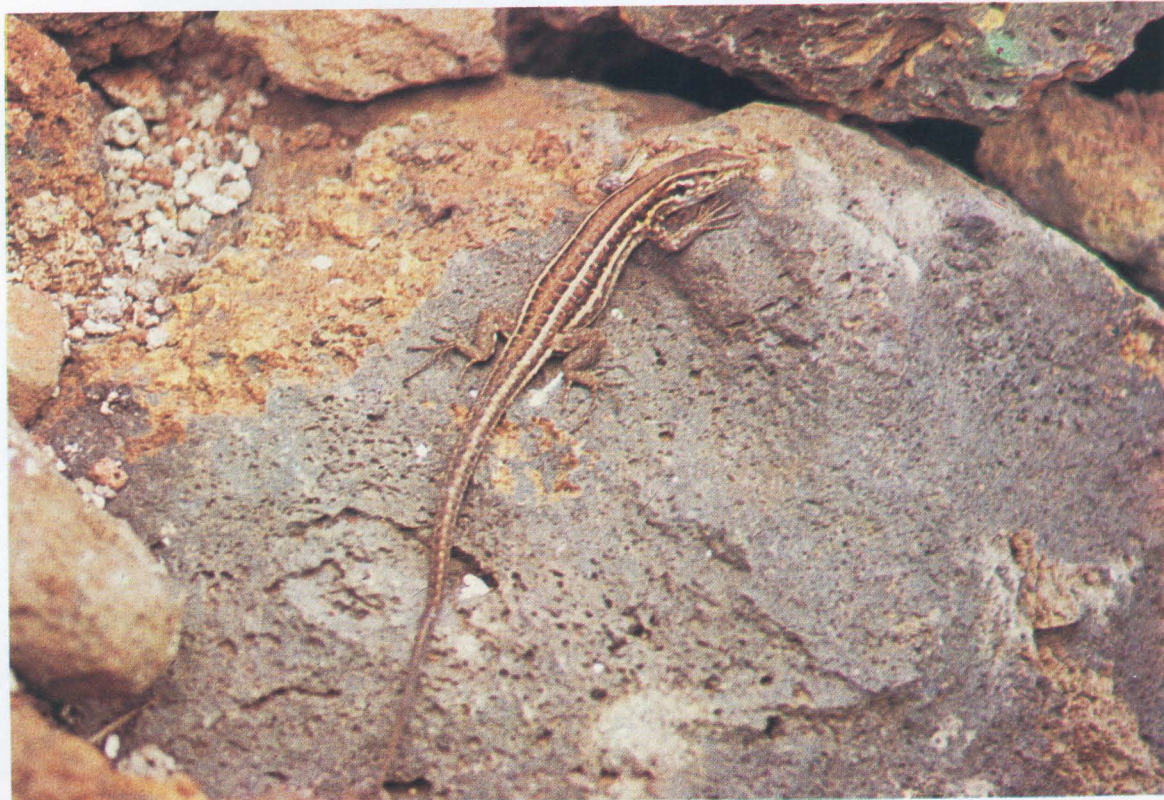
LAGARTO HEMBRA DEL NORTE

Coloración: En machos adultos de la zona Sur: cabeza y cuello oscuros, incluso negros; resto del cuerpo pardo-terroso con manchas azules en los laterales del cuerpo. Los machos adultos de la zona Norte o de zonas con mayor densidad vegetal, con manchas amarillas en el dorso y patas delanteras que pueden formar hileras.