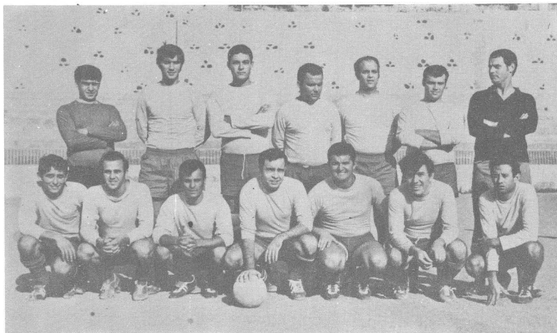
Caja Insular de Ahorros