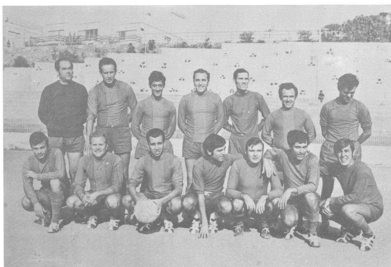
Banco Hispano Americano