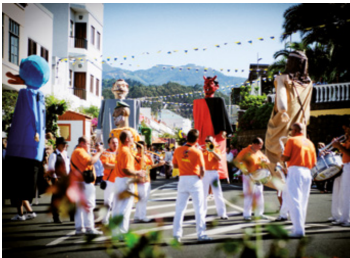
Fiestas en Moya.