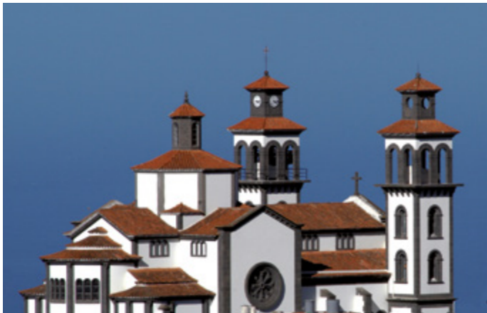
Iglesia de Moya.

En junio destaca la Romería en honor a San Antonio de Padua que tiene lugar el sábado más cercano al día 13. El 24 de agosto, Fontanales celebra a San Bartolomé donde la feria de ganado y la romería es compartida por lugareños y familias llegadas de otros pueblos. En el mes de octubre el municipio festeja al compatrono, San Judas Tadeo.