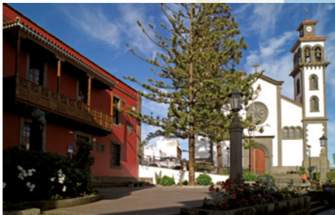
Casa-Museo del poeta Tomás Morales.

Seguidamente, bajaremos hacia la calle Padre Juanito, donde nos encontramos con el Centro de Arte e Interpretación y del Paisaje de Moya ; aquí a lo largo del año podremos contemplar distintas manifestaciones culturales tales como exposiciones, proyecciones, charlas, conferencias, etc.