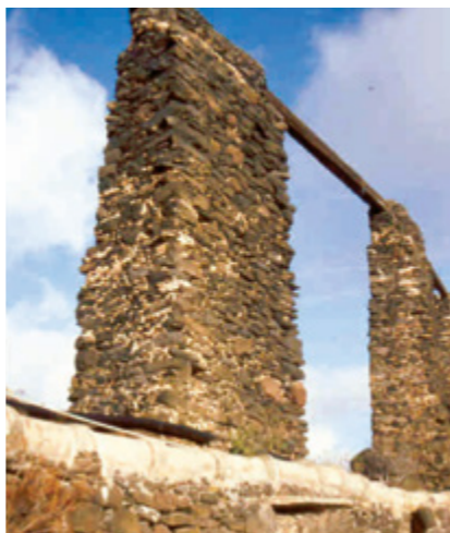
Acueducto de Las Canales.