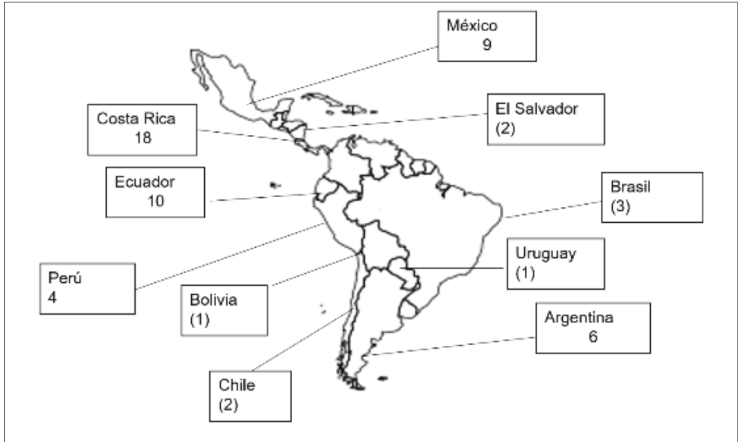
Imagen 2: Casos de éxito de Turismo Comunitario en América Latina