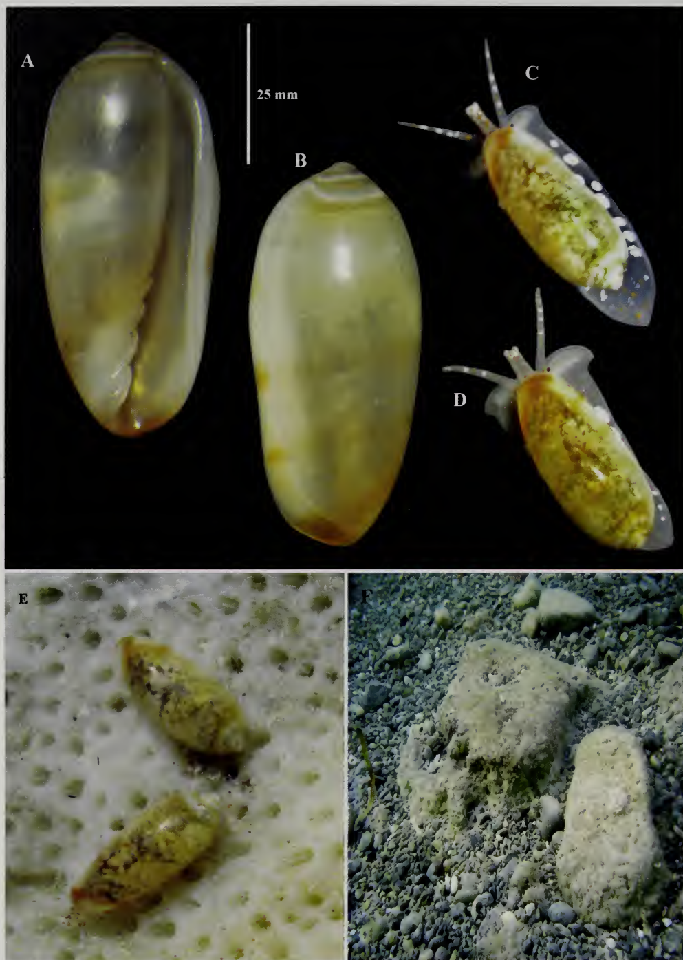
Lámina 1.- Volvarina baconi , especie nueva: A-B. Holotipo; C-D. Aspecto de los ejemplares vivos; E. Animales vivos observados in situ , debajo de una piedra coralina; F. Ambiente donde fueron colectados.