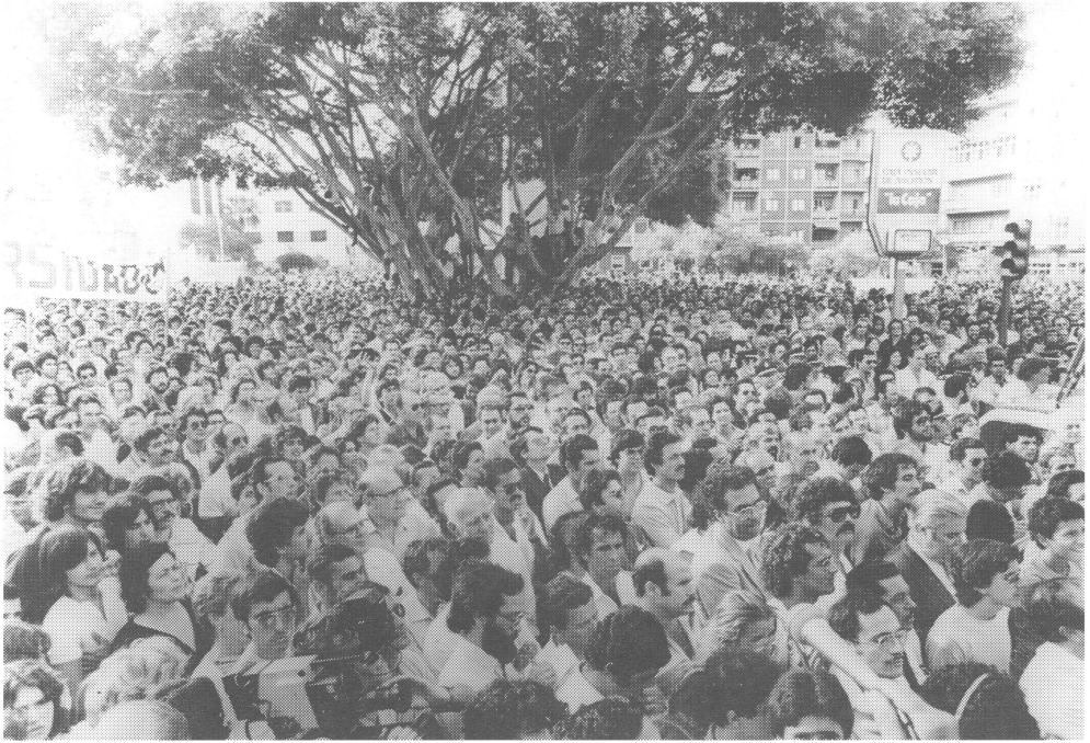
Manifestación pro Universidad. Plaza de la Constitución, 7 de Julio de 1982