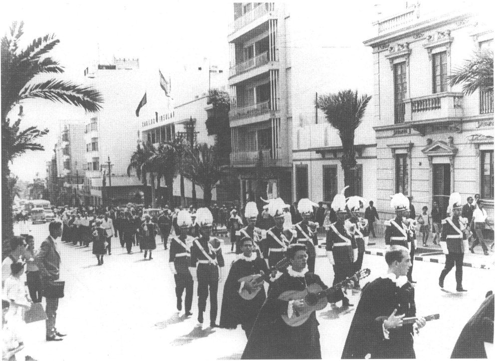
Inauguración de la Universidad Internacional de Canarias "Pérez Galdós". 1 de Agosto de 1962