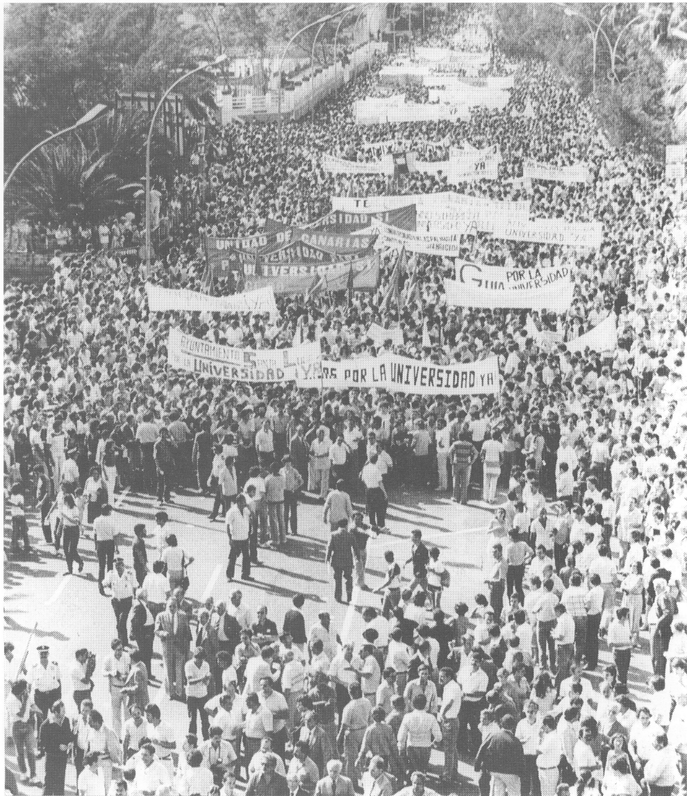
Manifestación pro Universidad. Calle León y Castillo. 7 de Julio de 1982