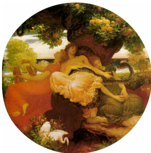
Ilustración 4. En El Jardín de las Hespérides , una pintura de Frederic Leighton (1892), posan en actitud de descanso las Hespérides, las tres ninfas que cuidaban de este preciado jardín situado en el último rincón del Occidente, a la sombra del árbol de las manza-

Aunque los diarios de ruta de Hannon y Escilax 17 , en el estado en que nos han llegado, no contienen pasaje alguno que pueda razonablemente aplicarse a las islas Canarias, es, no obstante muy probable que los cartagineses, y aun los fenicios, hayan tenido noticias del Pico de Tenerife. Vagas nociones de él habían llegado a los griegos en los tiempos de Platón y Aristóteles, y aquellos tenían para sí que toda la costa de África allende las columnas de Hércules había sido trastornada por el fuego de los volcanes. El paraje de los Bienaventurados que al principio se había buscado al Norte, más allá de los Montes Rifeos, entre los Hiperbóreos, y después al sur de la Cirenaica, fue situado en tierras que se imaginaban al Oeste, allí donde terminaba el mundo conocido de los antiguos (1995: 152-153).