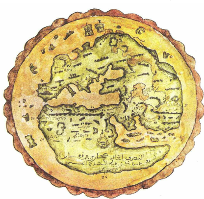
Ilustración 3. Antigua carta árabe (s. XIV) que muestra sobre plano los límites del mundo conocido. En ella se pueden observar una serie de islas cartografiadas en la región más occidental del Atlántico (justo al costado izquierdo de la imagen), que es probable que

Enfrente de Tandjah (Tánger) y del monte Atlas en el Océano Occidental están las islas Fortunadas, esto es, Felices, así llamadas porque los árboles producen frutos magníficos sin necesidad de cultivo, los prados alimentan trigos en vez de hierbas y los cardos se convierten en plantas olorosas. Estas islas, situadas al occidente del país de los Bereberes, se hallan diseminadas en el Océano a poca distancia unas de otras (Al-Bakri en A. Millares Torres, 1977, I: 145).