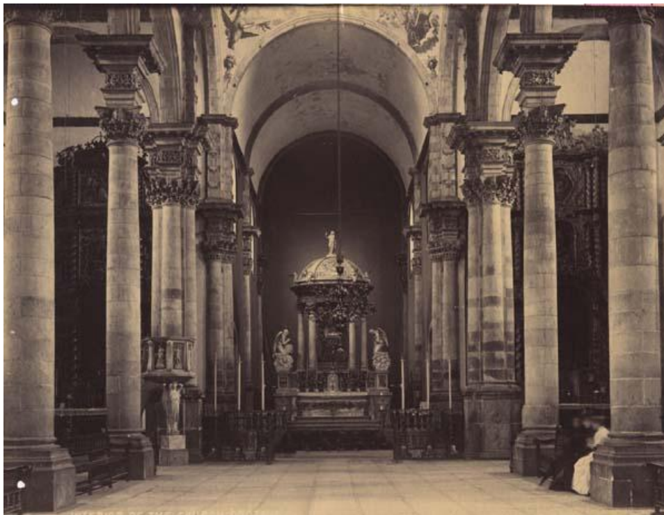
Visión interior del templo, década de 1890.