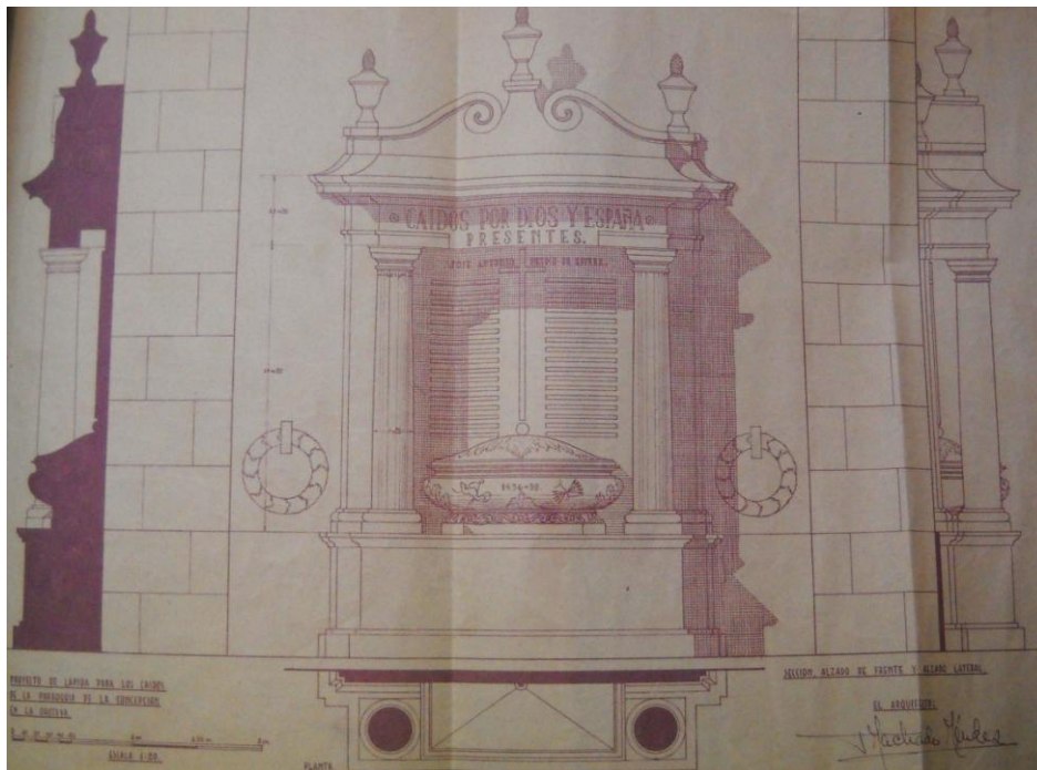
Proyecto del Monumento de los Caídos, 1941. AMLO.