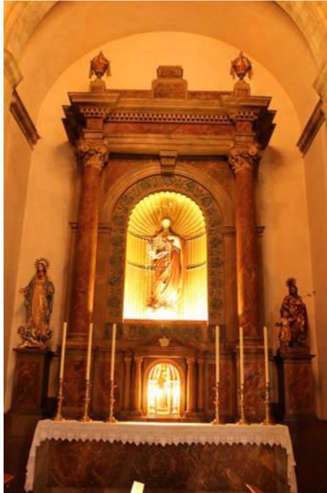
Antiguo retablo de Ánimas, 1814.