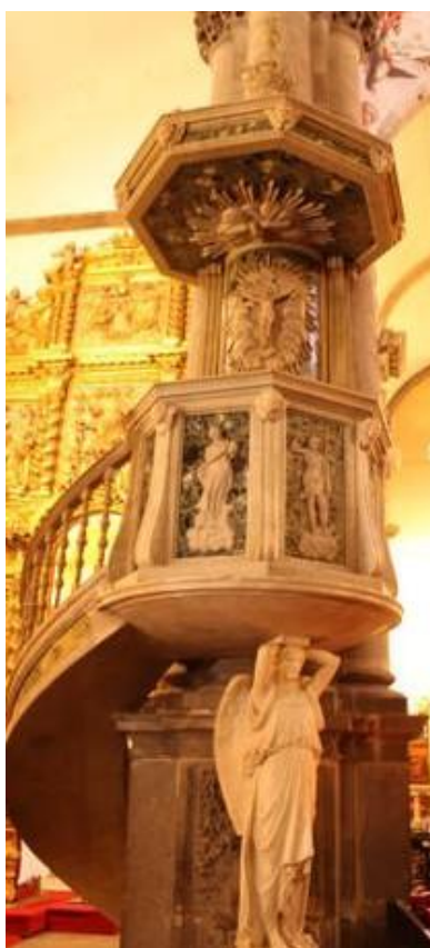
Tornavoz del púlpito, 1914-1915.