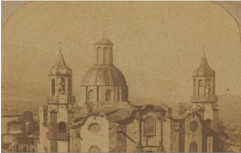
Visión exterior del templo, década de 1860.