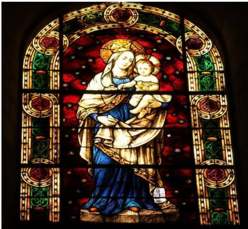
Vidriera, 1904-1914.