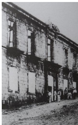
Antiguo y desaparecido palacio de Celada. Archivo particular, La Orotava. Foto: Anónimo, c. 1900.